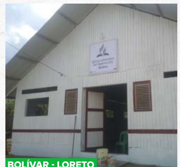
BOLÍVAR - LORETO

Finalmente, el templo de Bolívar fue terminado para gloria de Dios, todos estamos agradecidos porque aquel sueño es una bella realidad. Así como esta iglesia son muchos los proyectos de construcción que tiene Peru Projects, diversas congregaciones adventistas de la selva desean adorar a Dios en un templo y tú puedes apoyar a cumplir estos sueños. ¡Únete, qué nuestro Dios continúe bendiciendo tu vida también!