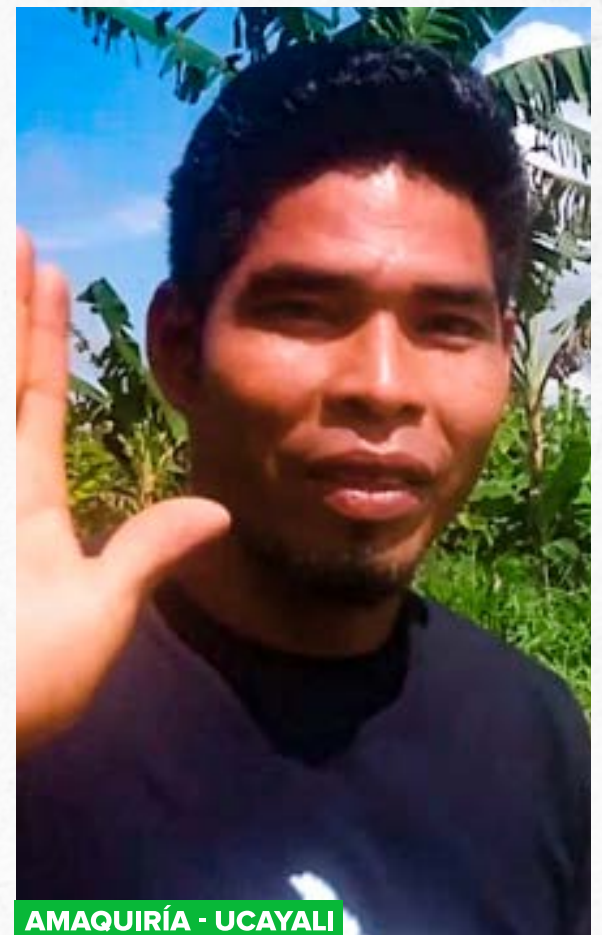
AMAQUIRÍA - UCAYALI