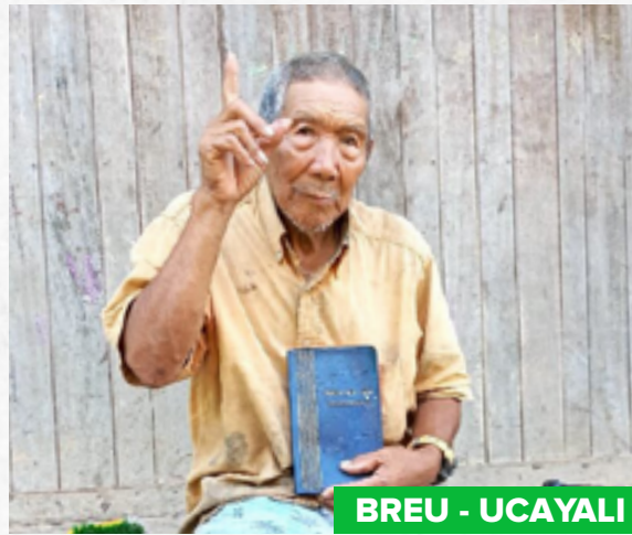
BREU - UCAYALI

Por: Robert Chuiso, pastor distrital en Peru Projects.