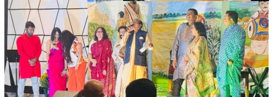
আনন্দমেলার সদা জাগরুক সারথীরা।