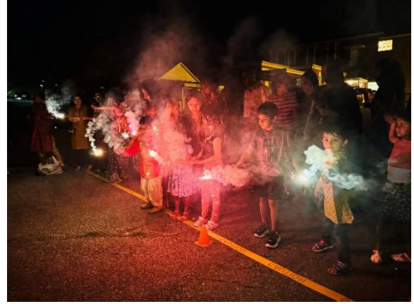
Kids were ecstatic during fireworks time as they could indulge in plenty of sparkles and watch colorful fountains go up.