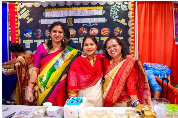
Bengal Sweet Corner and the Entrepreneurs

This year some super excited MSBA ladies wanted to set up a vending booth to show their culinary skills in making authentic Bengali sweets, snacks and tea.