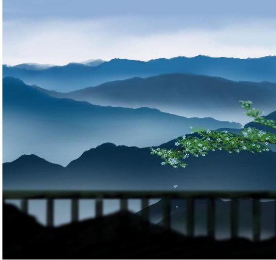
Serene Smoky Mountain with its first spring bloom of Sakura.

Presented his imagination with a digital artwork: