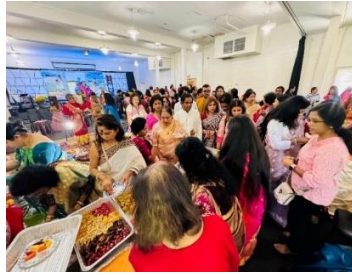
দুর্গাপূজোর প্রবেশদ্বার এবং আনন্দোৎসবের মধ্যবেলা