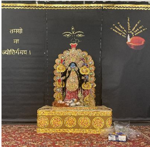
Maa Kali Idol and background Decor

Kali Puja and Deepavali, the festival of lights were celebrated on 2 nd November at Cordova Community Center. Exquisite hall and pandal decorations, dazzling Diwali lights and the puja proceedings added newness in the festive mood. Sumptuous and lip-smacking food made sure everyone was happy and the magical fireworks made this years Diwali an unforgettable one. Special fireworks, kids sparkles, colorful fountains were spectacular and made the night very special to remember for days.