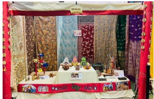
Exquisite Bengal pavilion with artwork, handicrafts and elegant display of handloom and silk sarees,

MSBA participated in India Fest organized by India Association of Memphis on Nov 9 th at Agricenter International. The theme of the fest was "Mela - Bringing Sights, Sound & Taste of India!" – it is a fact that Bengal is peerless in its rich landscape of rural fairs that not only showcase its rich legacy of folk songs, dance forms, cultures, festivals but also a marketplace for unique world renowned handicrafts, artworks, heritage handloom products such as 'Jamdani', 'Tangail' etc. as well as silk woven famous 'Baluchari Saree'. MSBA team spent days in crafting a panorama of display representing world acclaimed 'Poush Mela' of Shantiniketan and made an outstanding pavilion.