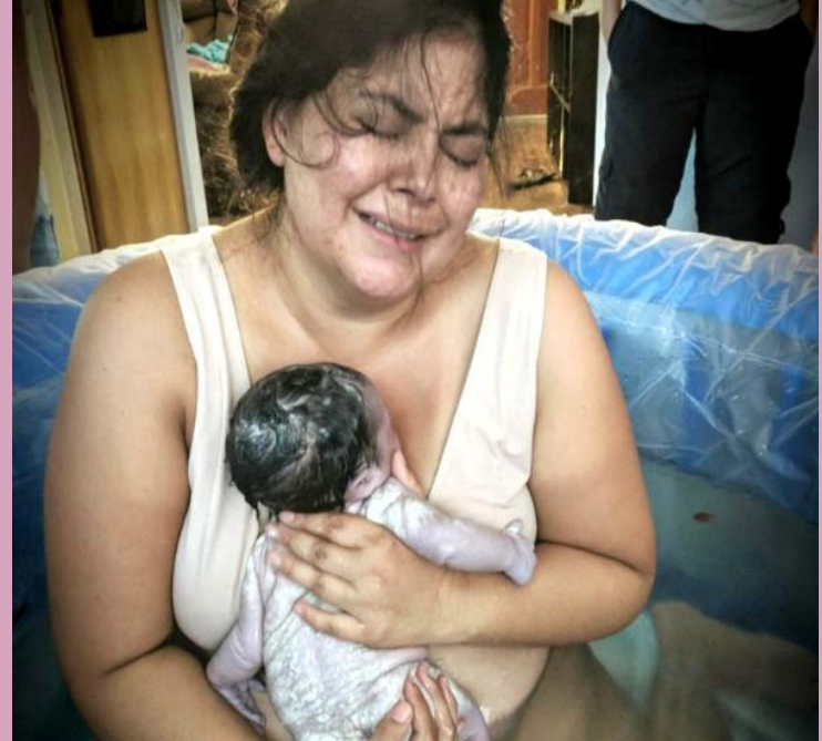
La foto de arriba es una mujer que acaba de dar a luz por vía vaginal después de 2 cesáreas.

El parto vaginal después de una cesárea es cuando una mujer da a luz por vía vaginal después de una cesárea previa. Esto puede referirse a un parto vaginal después de una, dos o tres cesáreas.