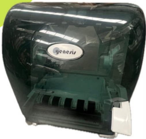
Dispensador de toalla en rollo Genesis