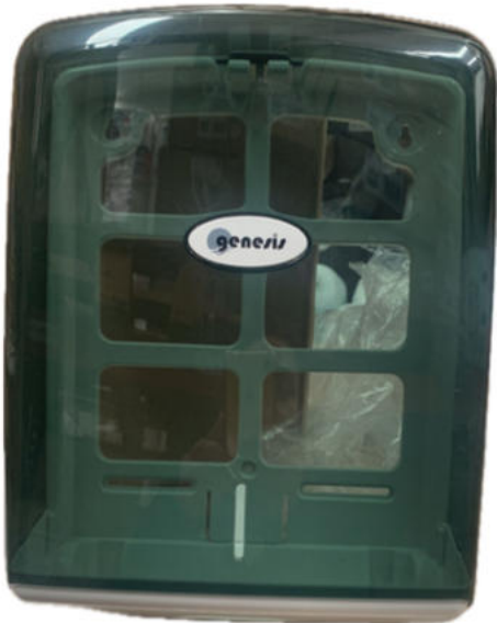
Dispensador de Toalla interdoblada Genesis