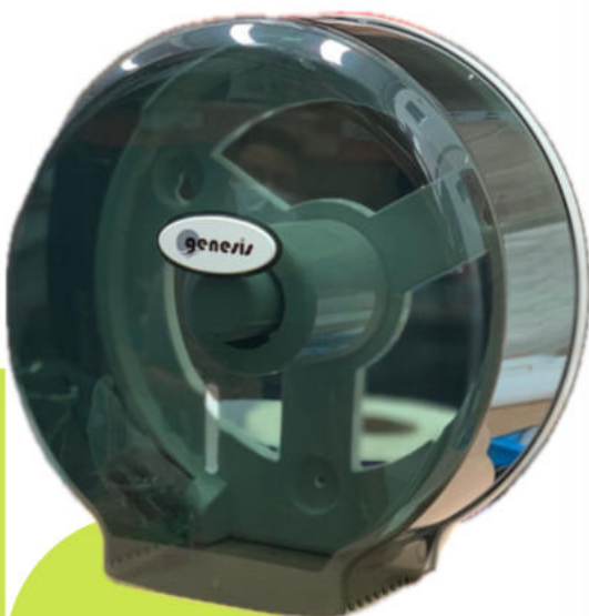
Dispensador de Papel higienico Genesis