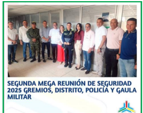
SEGUNDA MEGA REUNIÓN DE SEGURIDAD 2025 GREMIOS, DISTRITO, POLICÍA Y GAULA MILITAR