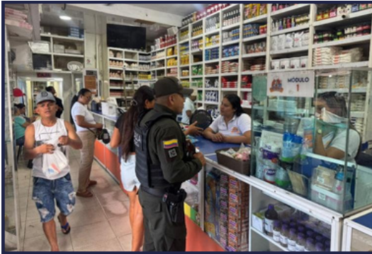
CAMPAÑAS DE PREVENCIÓN ANTIEXTORSIÓN - GAULA POLICIA

Se consolidó como una línea prioritaria de gestión, orientada a la protección integral de los afiliados, la mitigación de riesgos y el fortalecimiento de entornos seguros para el desarrollo de la actividad empresarial. La estrategia se centró en un enfoque preventivo, articulado y basado en la corresponsabilidad entre el gremio, las autoridades y la comunidad.