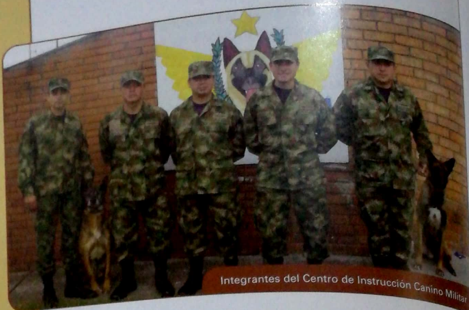
Integrantes del Centro de Instrucción Canino Militar

Ahora que la Fuerza Aérea adelanta el programa de pie de cría, espero poder realizar la Maestría en Medicina Interna para Pequeños Animales y así conocer detalladamente a cada paciente, además de contribuir con el proceso de reproducción, en el cual se proyecta tener dos partos por año, con camadas de 14 a 16 perros. Los que no sean seleccionados porque no demuestren habilidades para la detección se donarán a integrantes de la Institución, ya que no se pueden comercializar