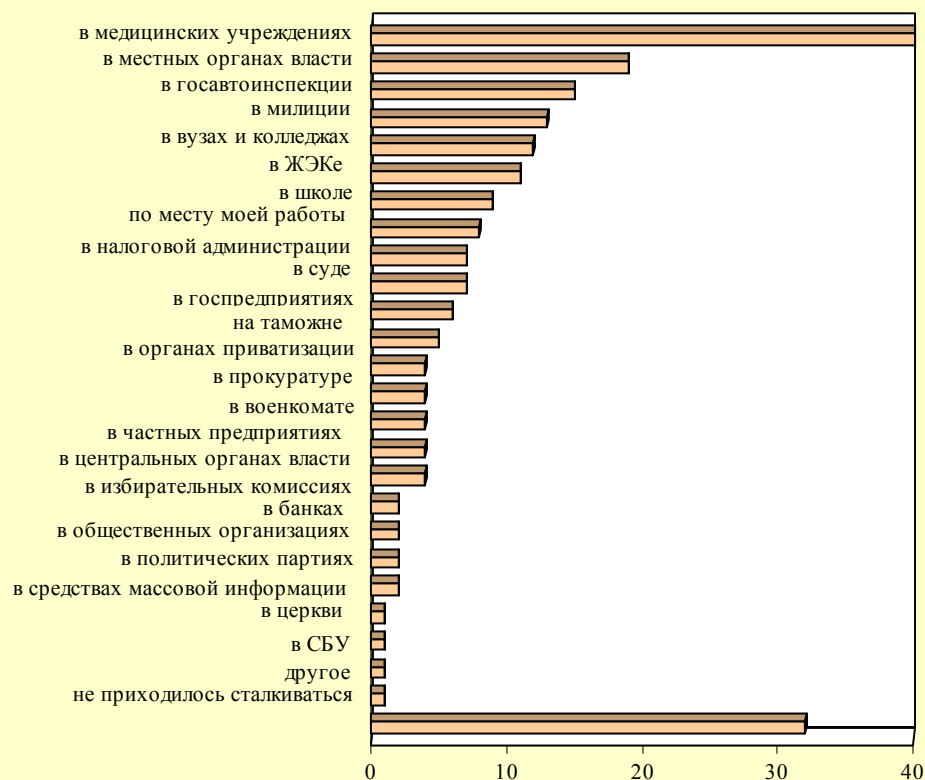
Рисунок 2. Ответы на вопрос: "В каких учреждениях Вам приходилось сталкиваться с проявлениями коррупции, взяточничеством или продажностью государственных служащих (должностных лиц)?" (респонденты могли выбрать несколько ответов) (%) (n=1200)

В целом по рассматриваемым странам более четверти опрошенных (28%) склонны предложить врачу денежное вознаграждение (взятку) за госпитализацию в случае отсутствия мест в больнице, по Украине эта тенденция еще более выразительна: так склонен поступить каждый третий (33%) (см. таблицу 1).