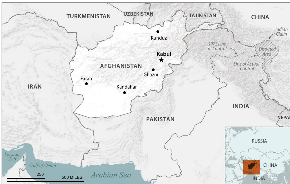
Figure 2. Afghanistan and Its Neighbors