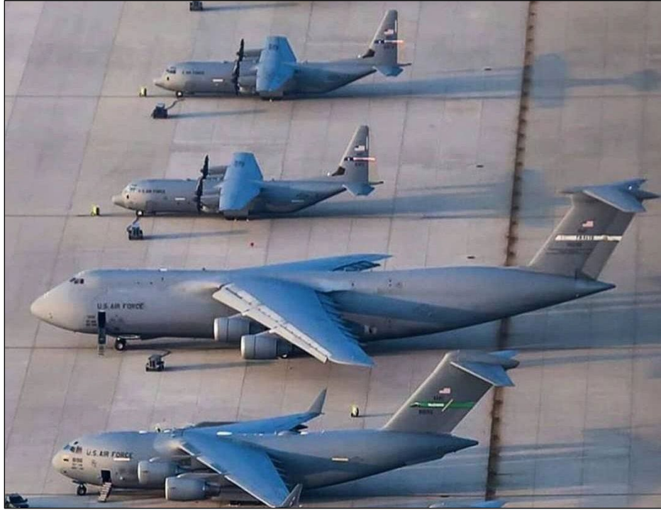
Figure 2. C-130, C-5 and C-17 Comparison