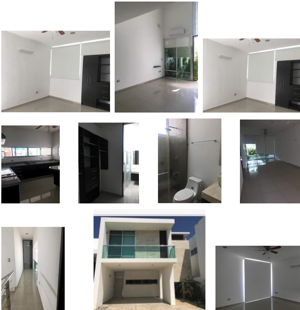
DISTRIBUCIÓN PLANTA BAJA ( NO TIENE ALBERCA )