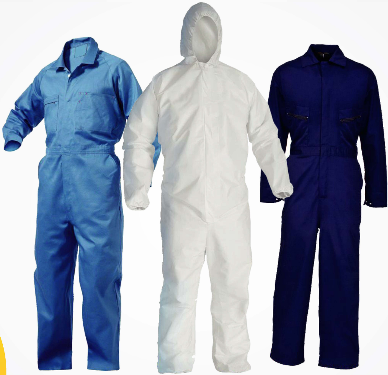
→ Uniformes Automotriz