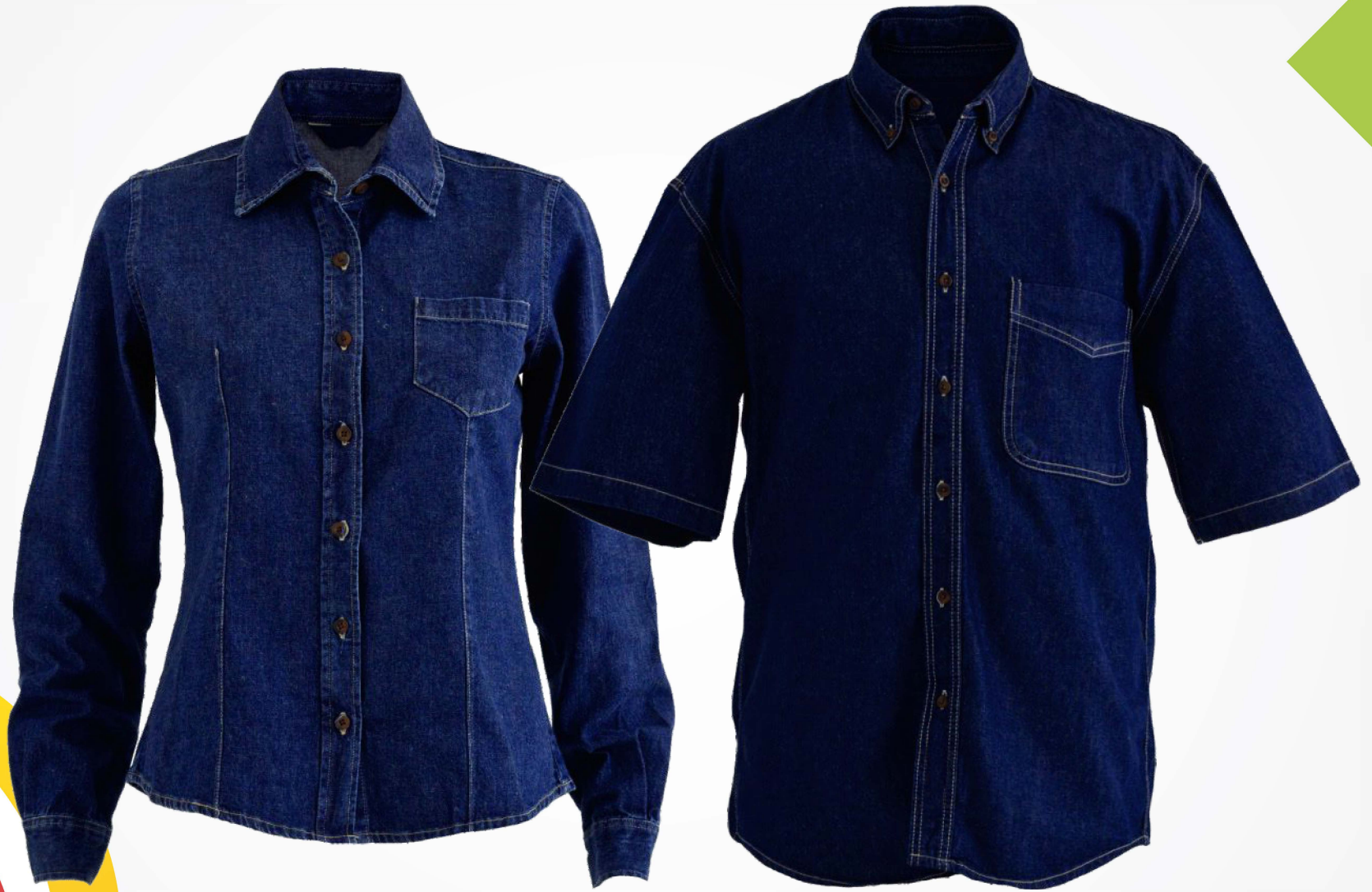
→ Camisas de Mezclilla