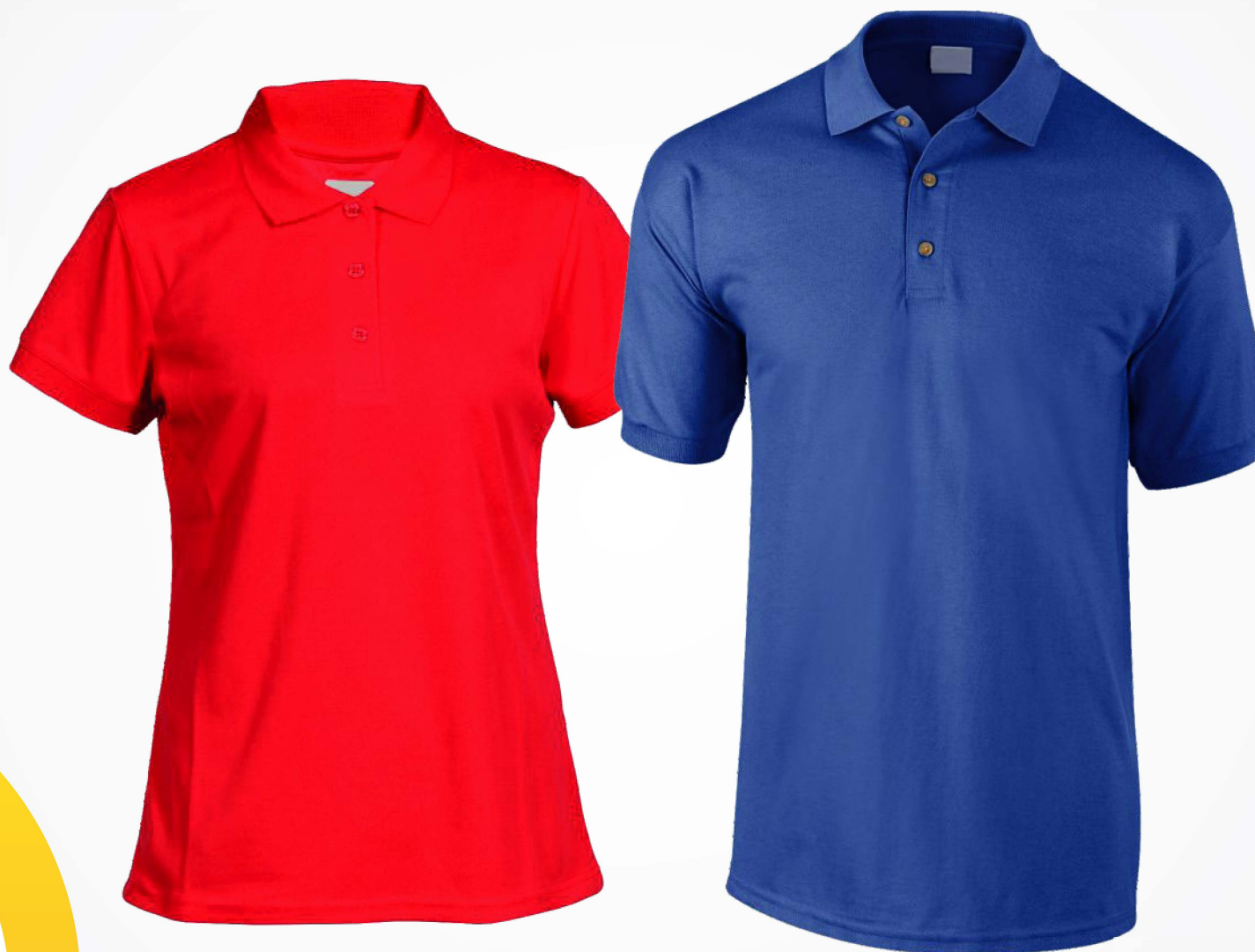
→ Playeras tipo Polo