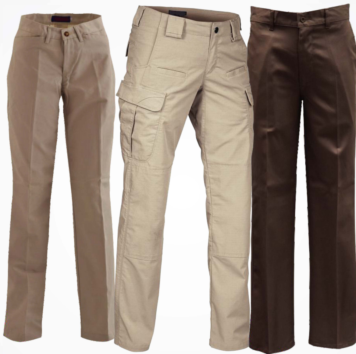
→ Pantalones de Gabardina