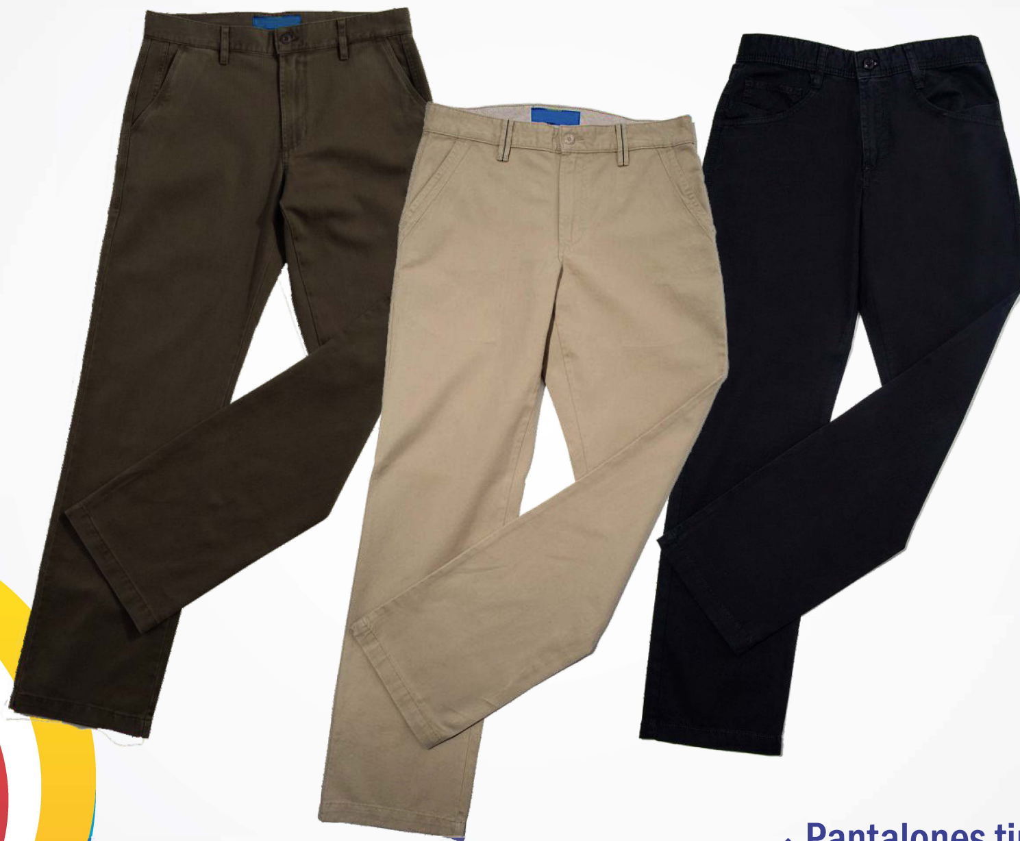
→ Pantalones tipo Dockers