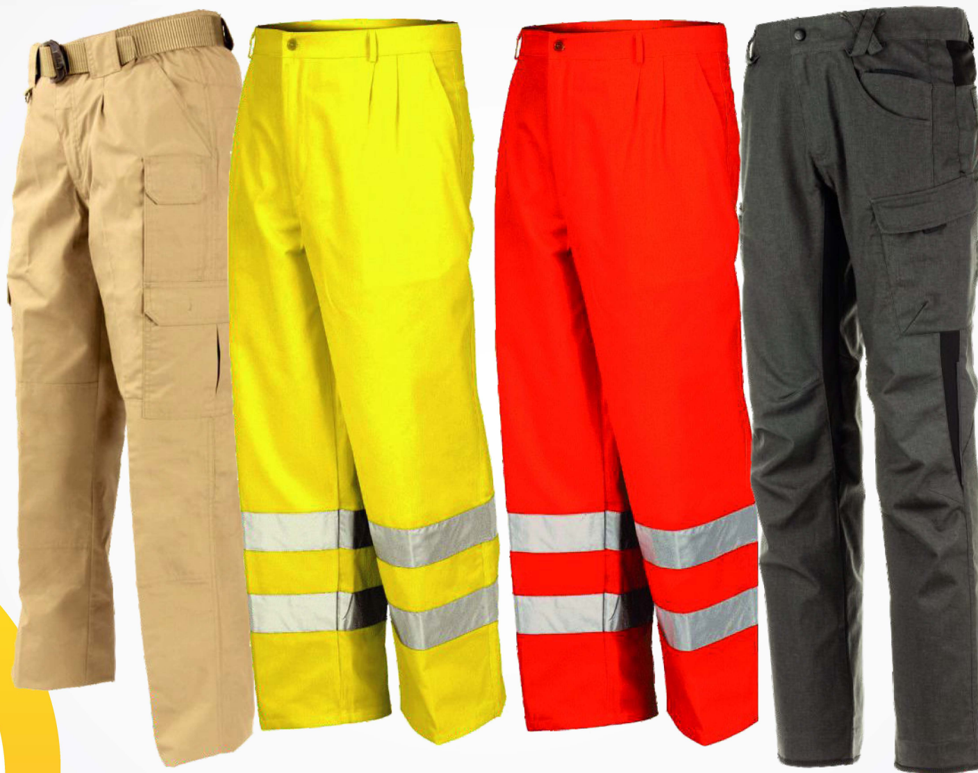
→ Pantalones Industriales