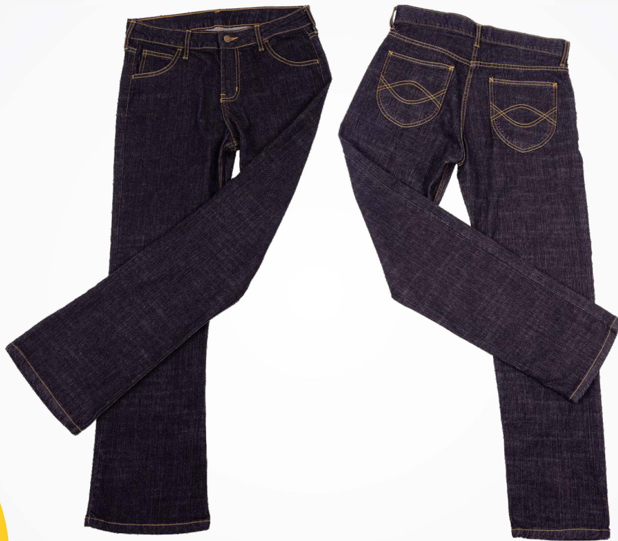
→ Pantalones de Mezclilla