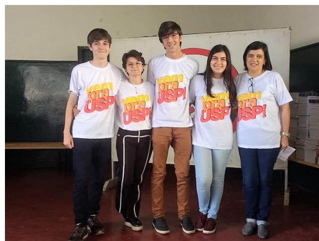
Alunos Premiados no evento.

Para 2019 os alunos do Grêmio e a coordenação ficaram incumbidos de propagar a ideia acerca da importância da participação da Escola na Competição.