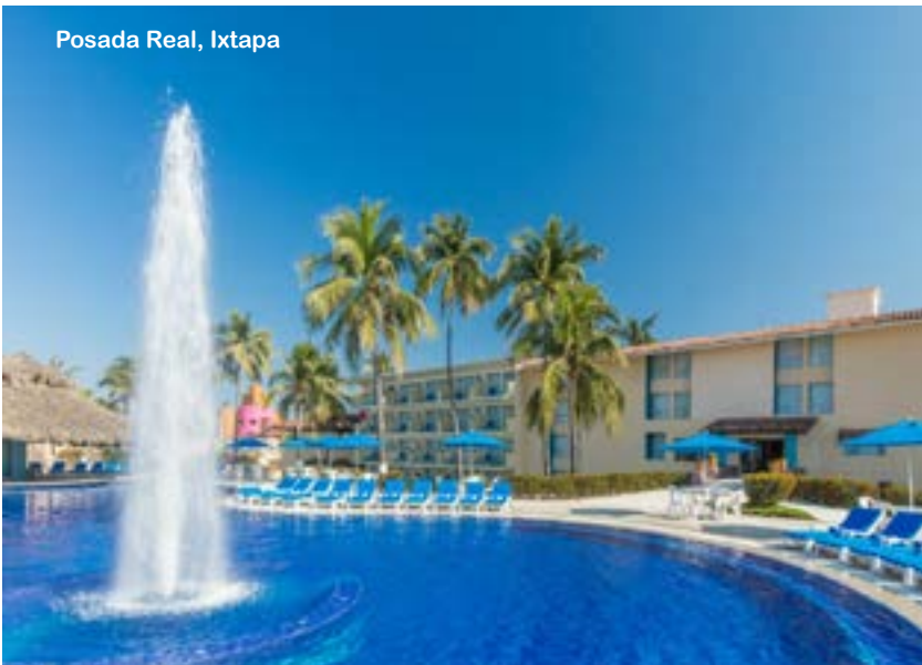
Posada Real, Ixtapa