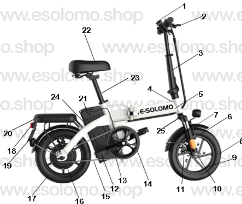
DIAGRAMA DE ESTRUCTURA GENERAL EB01

Nota: El diagrama de este manual es solo para ilustración y operación. No se utiliza como base para probar el producto. El modelo de bicicleta eléctrica real prevalecerá cuando exista alguna inconsistencia entre el modelo de bicicleta eléctrica real y esta imagen. Nuestra empresa se reserva el derecho de mejorar el rendimiento y la apariencia de los productos sin previo aviso.