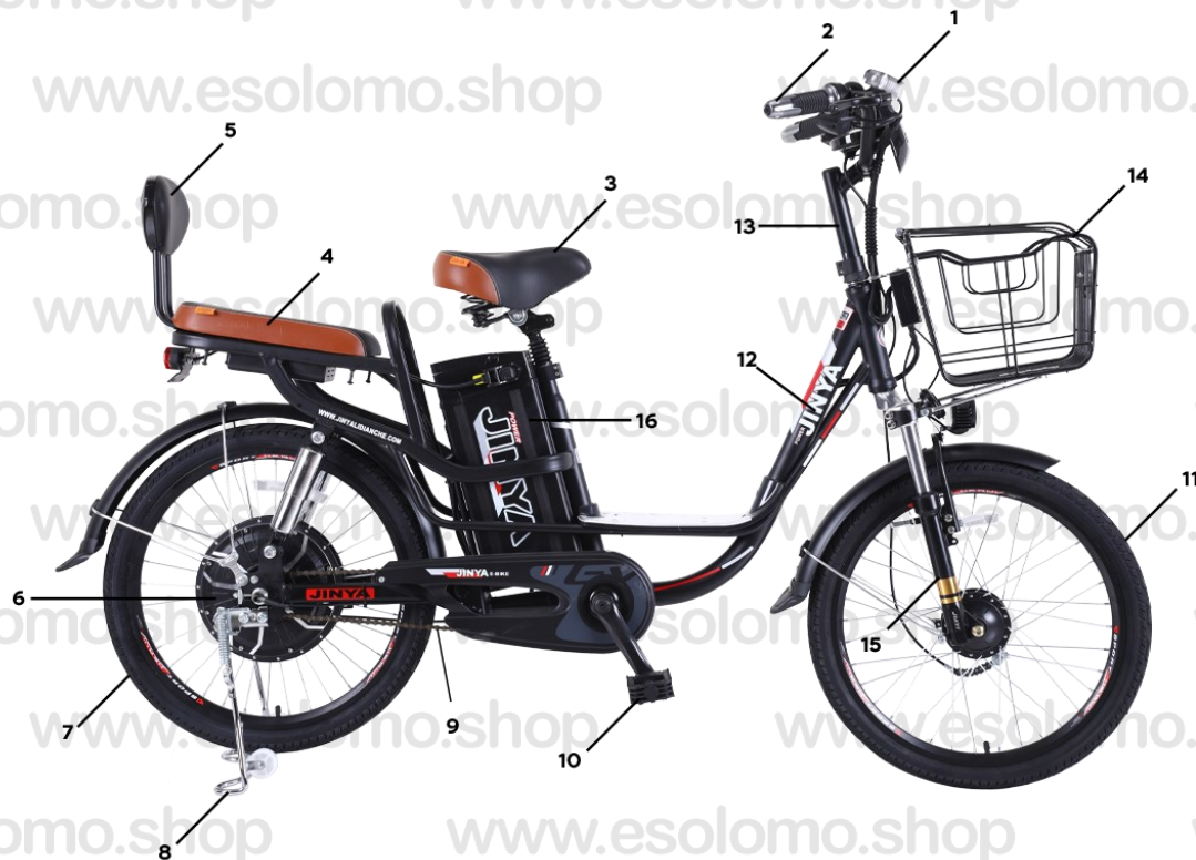
DIAGRAMA DE ESTRUCTURA GENERAL EB10

Nota: El diagrama de este manual es solo para ilustración y operación. No se utiliza como base para probar el producto. El modelo de bicicleta eléctrica real prevalecerá cuando exista alguna inconsistencia entre el modelo de bicicleta eléctrica real y esta imagen. Nuestra empresa se reserva el derecho de mejorar el rendimiento y la apariencia de los productos sin previo aviso.