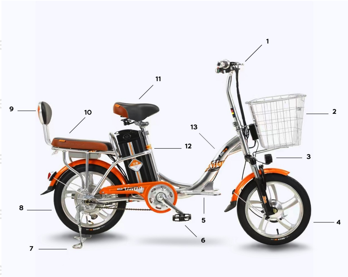
DIAGRAMA DE ESTRUCTURA GENERAL EB01

Nota: El diagrama de este manual es solo para ilustración y operación. No se utiliza como base para probar el producto. El modelo de bicicleta eléctrica real prevalecerá cuando exista alguna inconsistencia entre el modelo de bicicleta eléctrica real y esta imagen. Nuestra empresa se reserva el derecho de mejorar el rendimiento y la apariencia de los productos sin previo aviso.