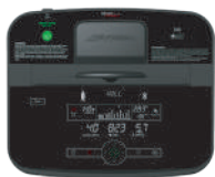
Track Connect 2.0 con Bluetooth mejorado