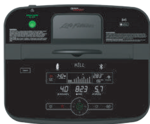
Track Connect 2.0 con Bluetooth mejorado