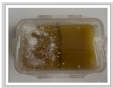
Foto inicio del Cultivo

Pero, a la mañana del cuarto día, al revisar, ya habían crecido mis colonias de microorganismos y en los otros días creció exponencialmente. Eso no es lo más emocionante, lo que más me gusta es saber que los pequeños microorganismos nos ayudan a muchas funciones en el medio ambiente y su importancia es fundamental para el desarrollo de muchas cosas de la naturaleza.