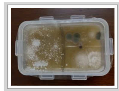
Foto final del experimento