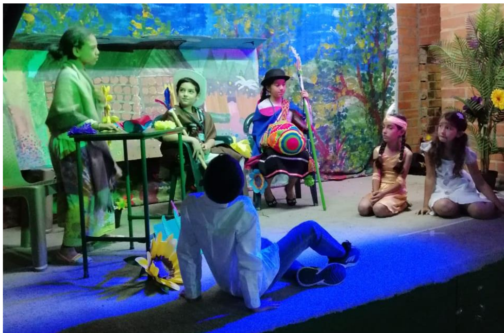
Niños y niñas disfrutando de su presentación teatral