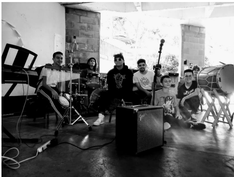
Grupo especial de música de bachillerato que participó durante el Festival artístico soleirano