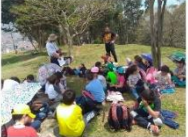
Foto y video del padre terreno en sesión pedagógica en el Corral El Solista

Soleira está comprometido al servicio de la vida en todas sus manifestaciones