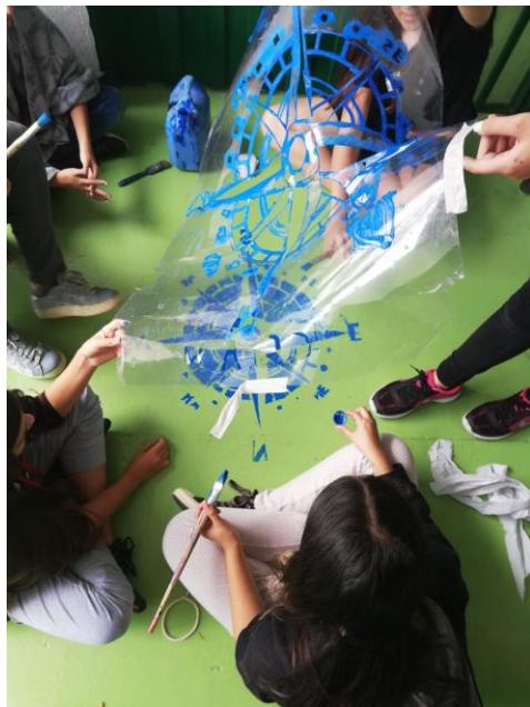
Jóvenes del grado séptimo realizando actividad de artes.