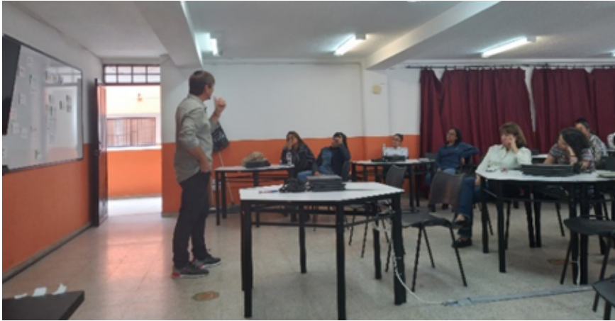
Figura 1: Socialización Investigación sobre la Participación Juvenil. IE José Antonio Galán. La Estrella, 2023.

Conscientes de la crisis en la educación, la Fundación Educativa Soleira asume el compromiso de aportar a la conversación en torno a maneras de abordar el acto educativo que permitan a estudiantes y docentes fortalecer su sensibilidad hacia el otro, fomentar el pensamiento crítico, generar ambientes educativos que nutran la comprensión y el respeto mutuo y enfrentar los desafíos que la sociedad actual se impone.