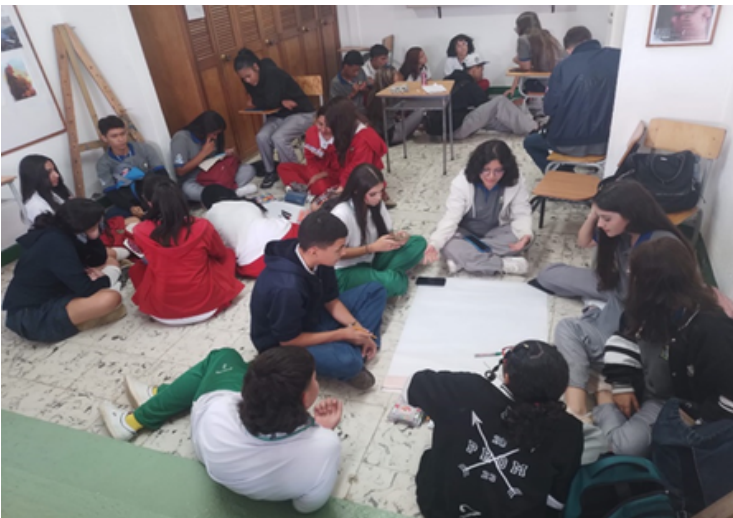
Figura 2: Encuentro final círculos de conversación. Estudiantes de colegios Ana Eva Escobar, José Antonio Galán y Concejo Municipal de La Estrella. 2023.

Conscientes de la crisis en la educación, la Fundación Educativa Soleira asume el compromiso de aportar a la conversación en torno a maneras de abordar el acto educativo que permitan a estudiantes y docentes fortalecer su sensibilidad hacia el otro, fomentar el pensamiento crítico, generar ambientes educativos que nutran la comprensión y el respeto mutuo y enfrentar los desafíos que la sociedad actual se impone.