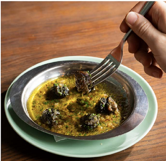
Escargot à la Bourguignonne 6只勃艮第蜗牛, 黄油, 大蒜, 欧芹