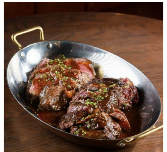
Cotes de Boeuf 1公斤无骨肋眼牛排,小牛排酱