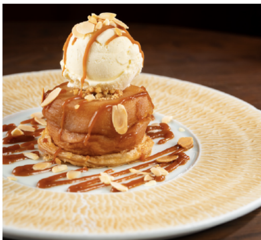
Tarte Tatin 苹果挞, 香草冰淇淋, 咸焦糖