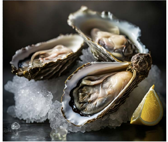
Huitres (6 pieces) 特制3号生蚝, 布列塔尼海岸普拉特-阿尔库姆