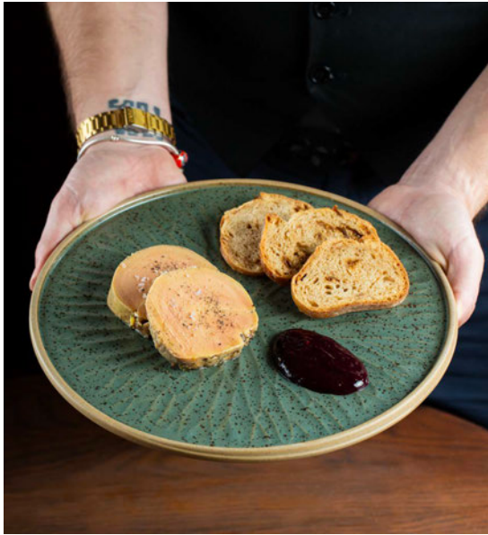
Foie gras terrine ,toasts and fruits confiture 鹅肝酱冻，烤面包和水果果酱。