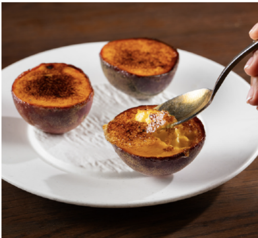
Crème Brulée Fruit de la Passion 焦糖奶油布丁, 百香果