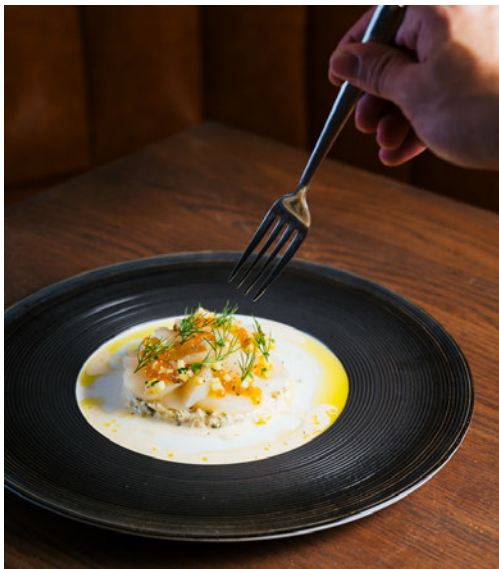
Carpaccio de St Jacques 扇贝薄片，蟹钳肉，蛋黄酱，鲑鱼子，莳萝