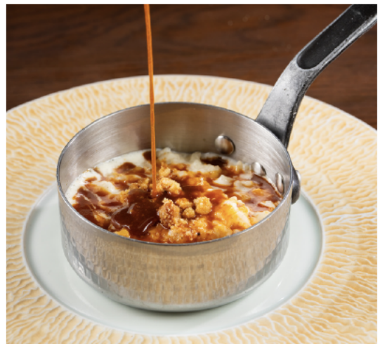
Riz au lait 马达加斯加香草米布丁, 咸黄油焦糖