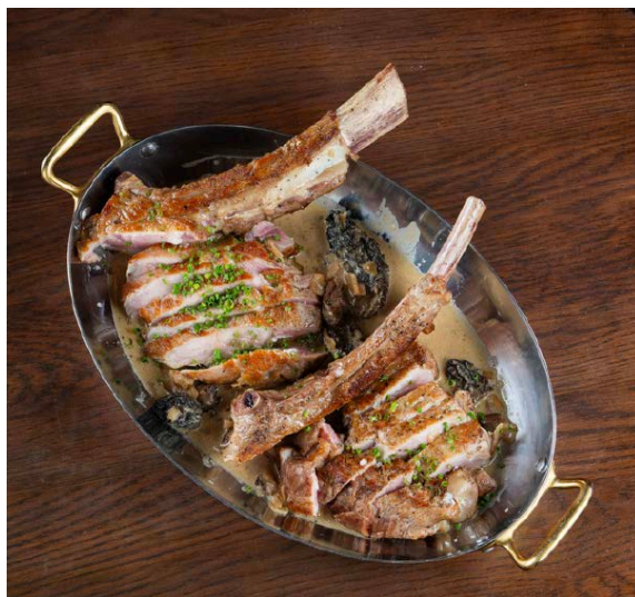
Double Côte de Veau 双骨小牛排,800克法国小牛排,黑松露,红酒酱。