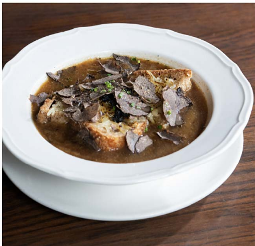
Soupe à l' Oignon 法式洋葱汤, 格吕耶尔奶酪和松露面包丁