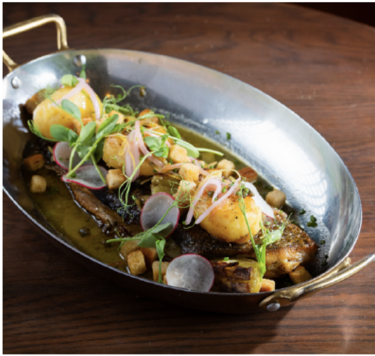
Sole entière 800克多佛尔比目鱼, 黄油, 柠檬, 慢煮, 腌渍