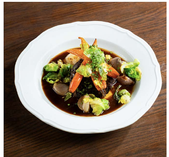
Boeuf Bourguignon 牛颊肉, 布鲁塞尔芽菜, 红酒, 青葱