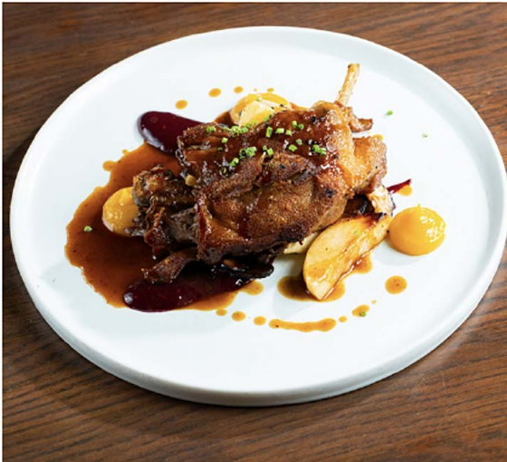
Cuisse de Canard 鸭腿慢煮, 苹果, 香菇