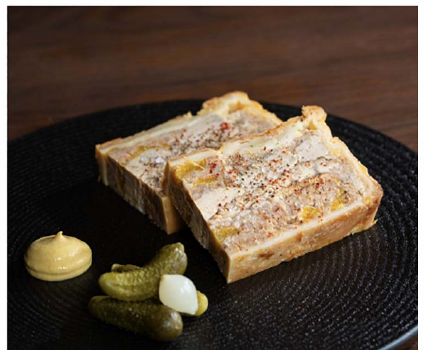
Pâté en Croûte 用雷司令葡萄酒烹制的猪肉酱, 烟熏鳗鱼, 鹅肝, 腌菜