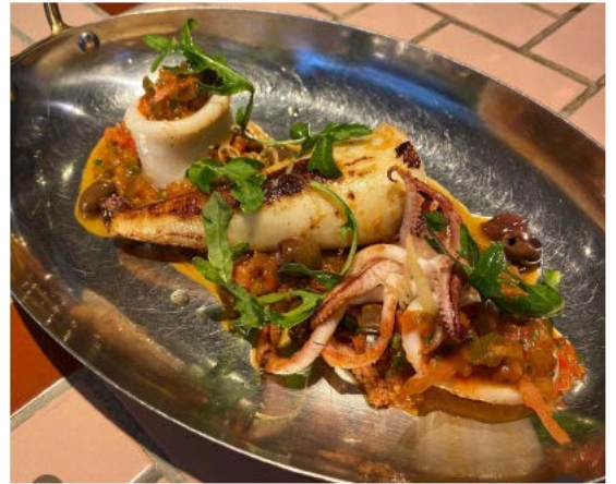
Grilled Squid, Vierge Sauce 烤鱿鱼,维尔日酱,橄榄