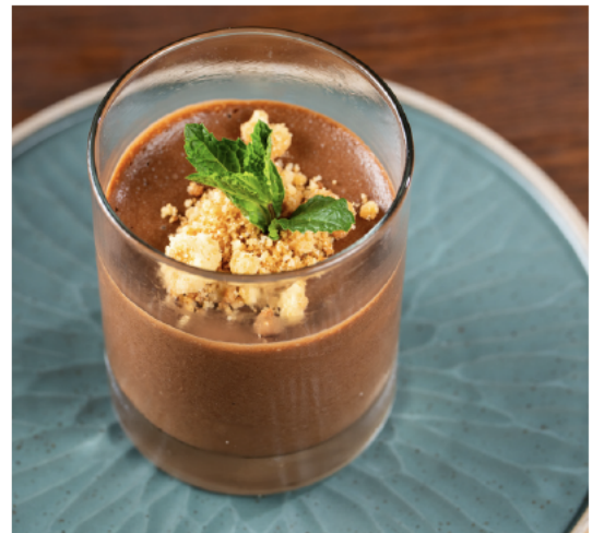
Mousse au Chocolat 70% 黑巧 克力 慕斯