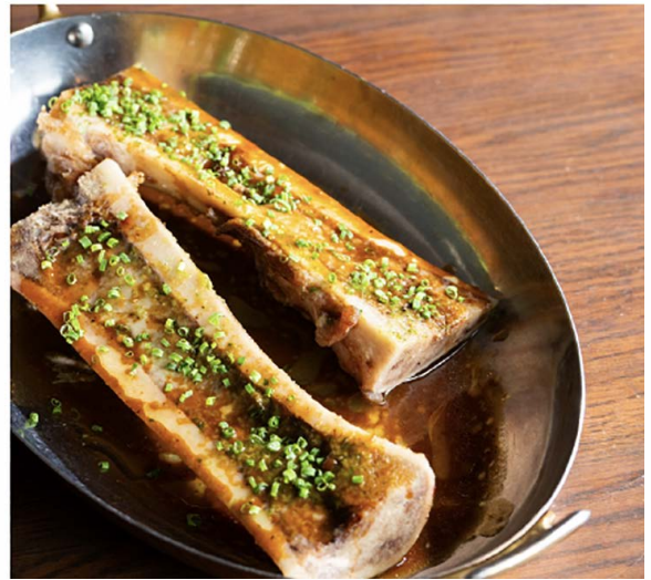
Os à Moelle 骨髓