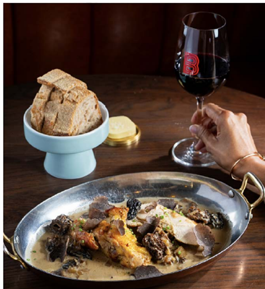
Volaille aux Morilles 鸡胸肉, 黑松露, 奶油黄酒