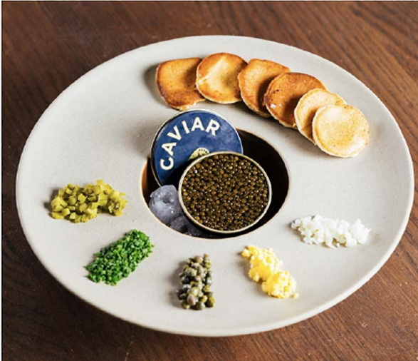
Caviar Kristal Kaviari & Champagne 30克Kariar "Kristal Kaviari", 小松饼和两杯香槟