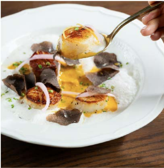
St Jacques la plancha 烤扇贝,南瓜,帕玛森芝士乳酪,松露油