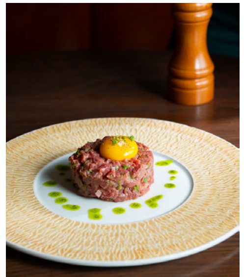
Tartare de Boeuf 150克阿基坦金发女郎，经典的牛肉塔塔