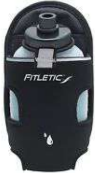
SINGLE | SIMPLE AD08-01 : 818055010215

For long-distance runners, back country hikers, and anyone else who needs to go the extra mile. Lightweight yet rugged holsters slide on to any running belt.