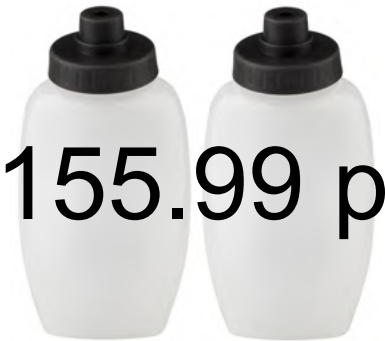
PAIR | PAIRE RB08-01= 8oz 818055011335