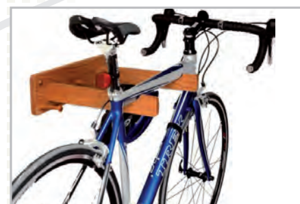
Golden Pecan ( )