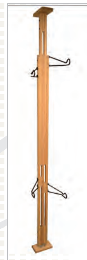
Naturel / unfinished (-U)