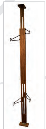
Noyer foncé/ Dark Walnut(-W)