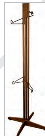
Noyer foncé / Dark Walnut(-W)