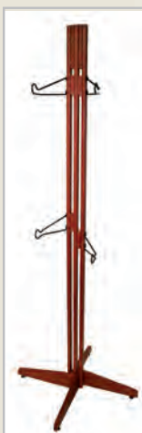
RougeSedona / Sedona Red (-R)