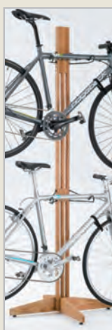
Golden Pecan ( )