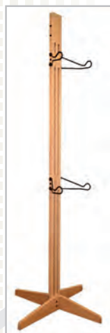
Naturel / unfinished (-U)