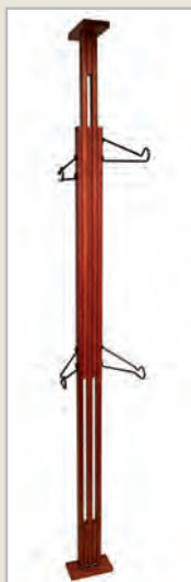
RougeSedona / Sedona Red (-R)