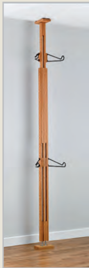
Golden Pecan ( )