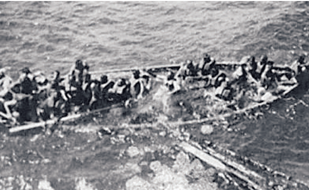
જીવ બચાવવા દિવસો સુધી આવી નવ લાઈફબોટમાં લોકોએ દરિયો ખૂંદો હતો.

બીજું વિશ્વયુદ્ધ ચાલી રહ્યું હતું ત્યારે આફ્રિકાના જુદા-જુદા દેશોમાં અઢળક ગુજરાતીઓ કામની તલાશમાં જતા અને ત્યાં તેઓ વસેલા હતા. ૧૯૪૨માં જ્યારે વિશ્વયુદ્ધ ચાલી જ રહ્યું હતું ત્યારે ૨૦ નવેમ્બરે બ્રિટિશ ઇન્ડિયા સ્ટીમ નેવિગેશન