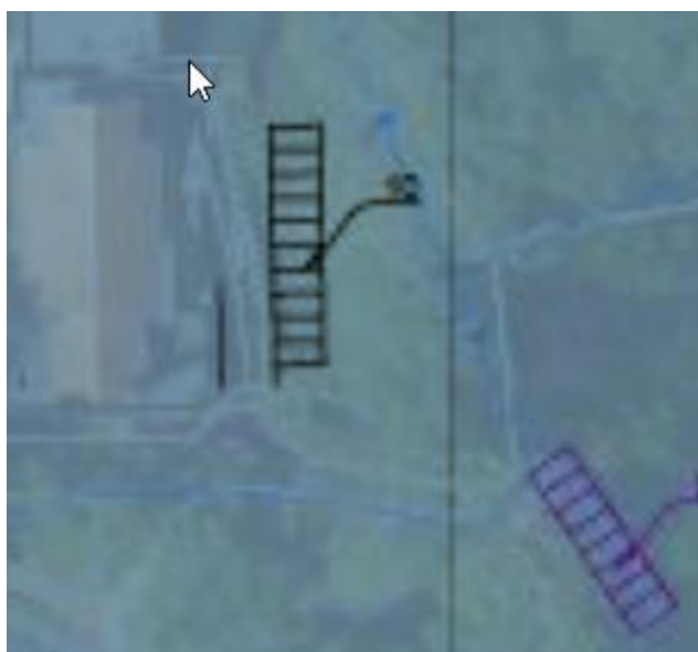
Dienstengebouw (NNN gebied)