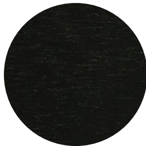
79 | ESPRESSO