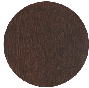
06 | CAFÉ MAT — MATTE COFFEE