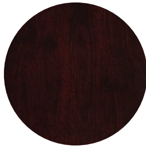
01 | CERISIER — CHERRY

SÉLECTIONNEZ VOTRE FINI DE BOIS CHOOSE YOUR WOOD FINISH