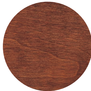
16 | BRUN MOYEN — CHESTNUT