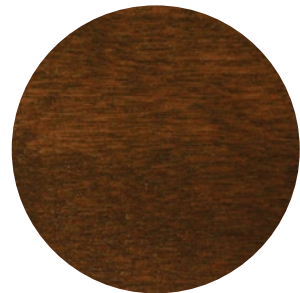
18 | MOISSON — HARVEST