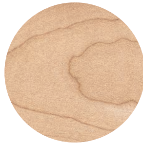
03 | NATUREL — NATURAL