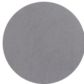
85 | GRIS — GREY