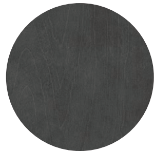
86 | GRIS CHARBON — CHARCOAL GREY