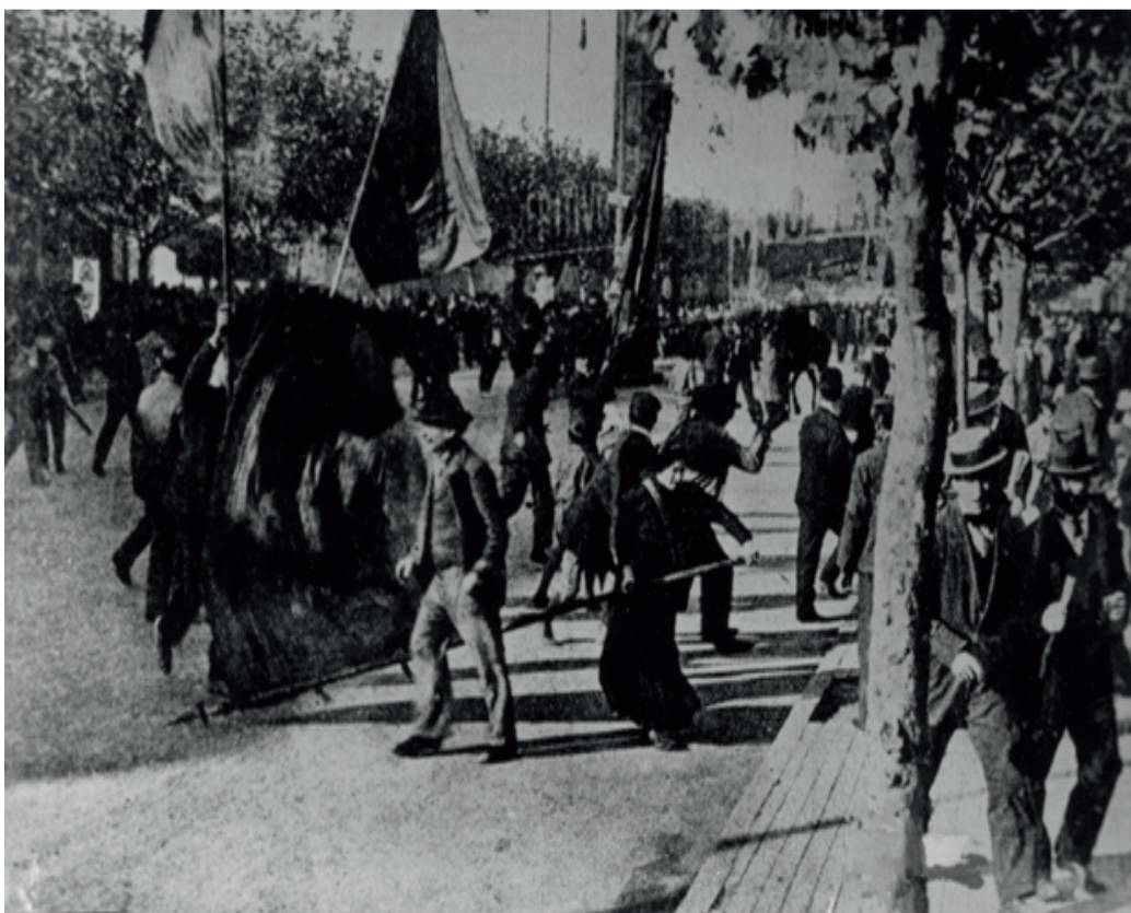
Movilización obrera 1896