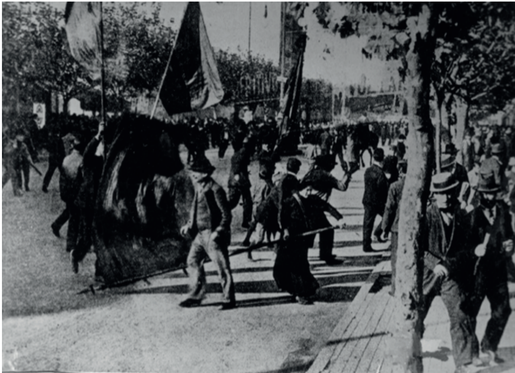
Movilización obrera 1896

En ese contexto de lucha de intereses, los obreros talabarteros (junto a otros gremios), irrumpen con una consigna que será la abanderada de las próximas demandas de la clase: “La reducción de la jornada laboral a 9Hs”. La Sociedad de Obreros Talabarteros, encara así, una histórica y descomunal lucha durante 46 días por menos horas de taller para disfrutar más la vida (recorremos que en esas épocas las jornadas iban de 12 a 16 hs diarias). Para 1898 y dentro de una arremetida conservadora, el gremio talabartero sostiene casi en soledad una serie de huelgas y acciones en ese sentido (que 10 años después sería llevada al parlamento por el primer diputado socialista de América Latina, Alfredo Palacios).