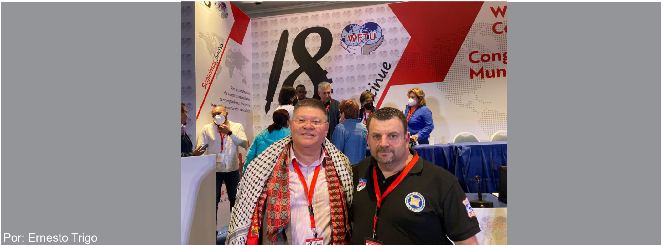
Por: Ernesto Trigo

Celebrado en Roma, Italia entre el 6 y el 8 de mayo de 2022, fue sin lugar a dudas un evento histórico de la clase obrera internacional donde participaron más de 90 países con 430 delegadas y delegados.