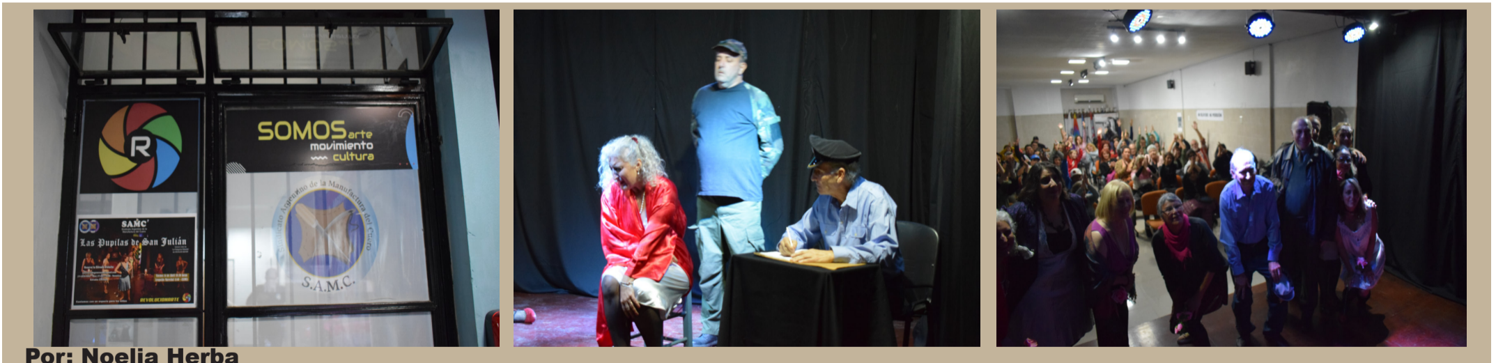
Por: Noelia Herba

El día viernes 14 de abril, en la sede del sindicato argentino de la manufactura del cuero, con organización a cargo de la comisión de género y a sala llena, se presentó la obra teatral “Las Pupilas de San Julián” en el marco de la inauguración del centro cultural RevolucionArte.