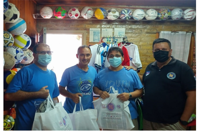
Por: Jesús Viscarra

Luego de finalizar una temporada de verano donde rompimos récords de concurrencia en nuestra quinta y de haber entregado un año más el kit escolar, encaramos el primer semestre del año con ganas de ir por más, trabajando fuertemente para que cada día se puedan mejorar aspectos que hacen a la recreación y el acompañamiento de las y los trabajadores.