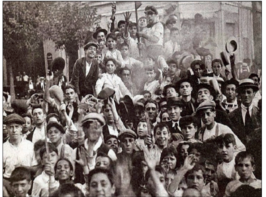
Huelgas por la reducción de la jornada laboral