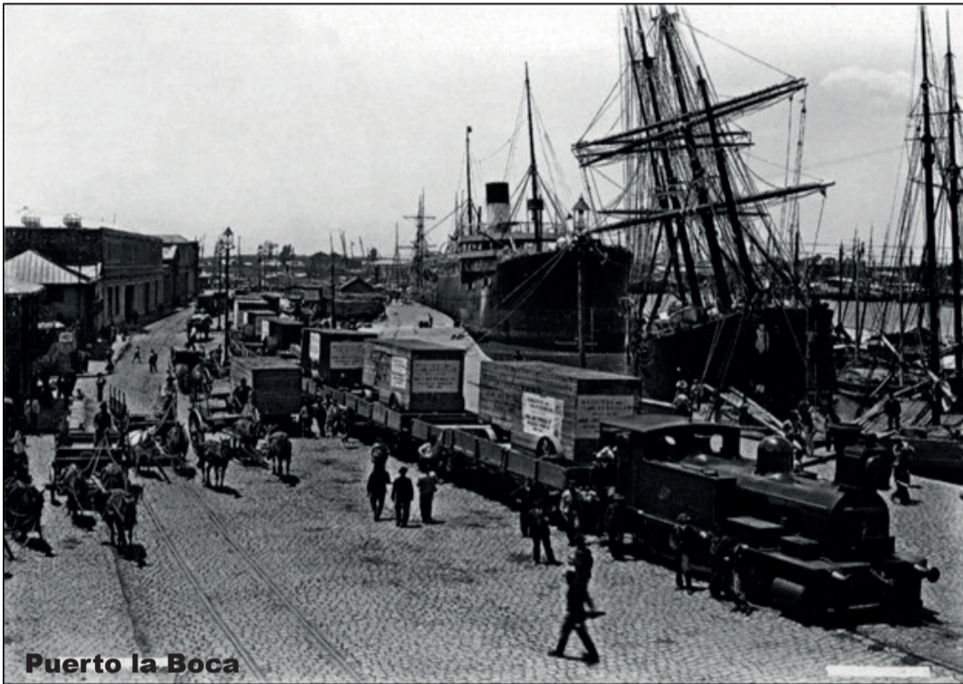
Puerto la Boca

Mediando el año 1855, (tres años después de la caída de Juan Manuel de Rosas y veinte antes de que Alexander Graham Bell patentara el primer teléfono), las mujeres coristas del Teatro Argentino se pusieron al frente del primer movimiento con carácter claramente reivindicativo, reclamando una función anual en su beneficio. Para 1857, se funda la Asociación Tipográfica Bonaerense y también la Sociedad de Zapateros San Crispín, como herramientas de carácter mutual. En 1871 los lancheros de la Boca decidieron levantar sus remos ante la intención patronal de rebajar sus salarios.