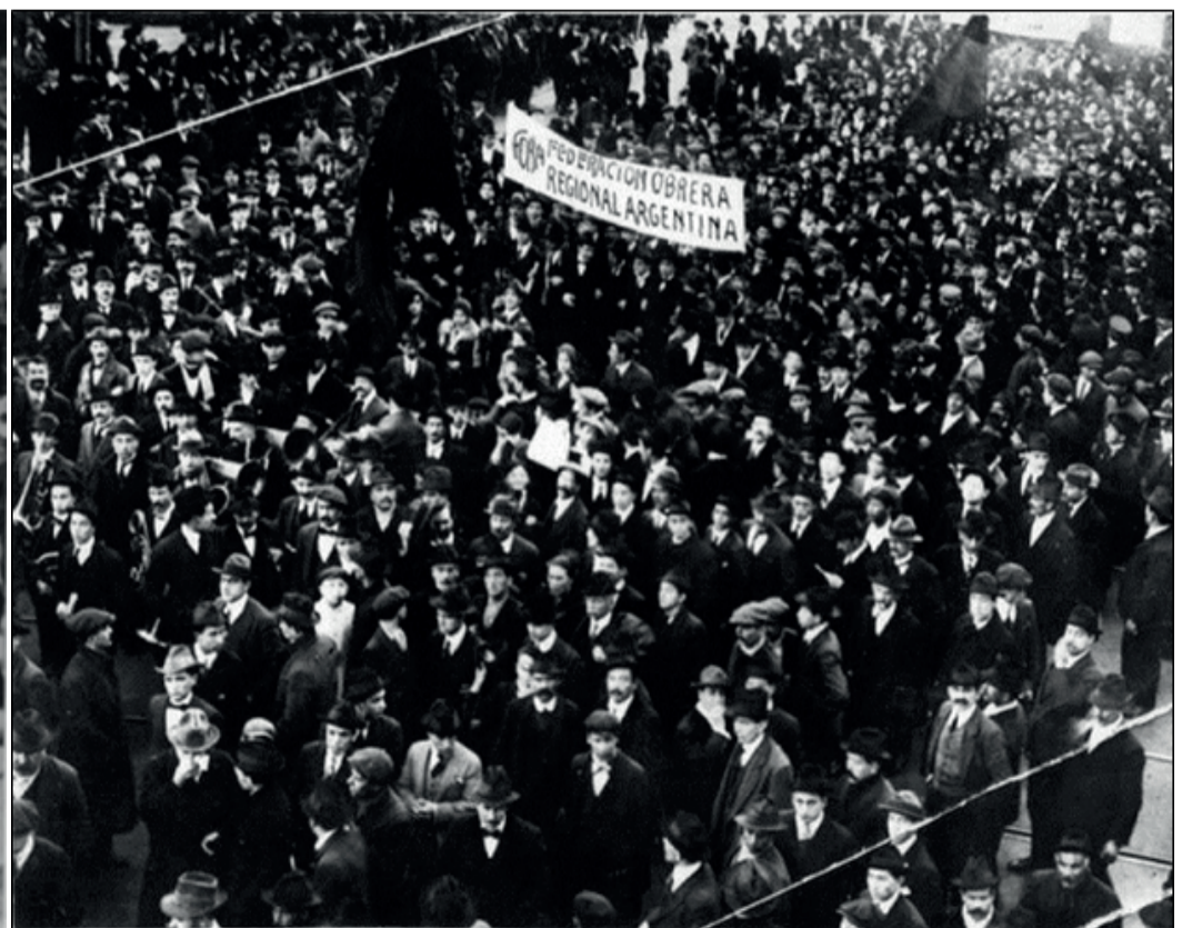
Marcha de la FORA