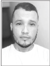
NIDIO QUIROZ [COLABORADOR]

“...en Codazzi con júbilo inmenso de Colombia se canta la gloria que refiere orgullo la historia cuando el triunfo nos dio libertad”