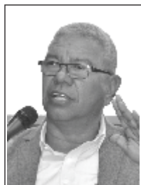
JAIRO ENRIQUE SOTO HERNÁNDEZ [COLABORADOR]

«Elegir la propia máscara es el primer gesto voluntario humano. Y es solitario»