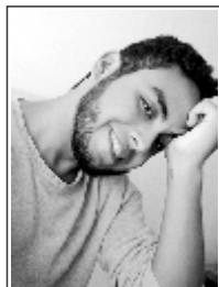
CAMILO VILLANUEVA [COLABORADOR]

«Mucha gente pequeña, en lugares pequeños, haciendo cosas pequeñas, pueden cambiar el mundo.»