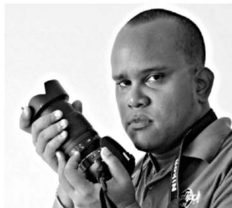
Páginas: 9, 20, 21.

Es profesor de dibujo, pintura y fotografía. Fotógrafo profesional. Ha tenido varias distinciones, entre las cuales están: World Photography Day , National Academy Of Photography en Kolkata, India, 2019. Y, La alternativa del millón en La Galería, Plaza de La Paz, Barranquilla, 2018.