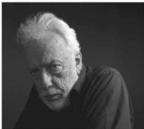
Portada. Páginas: 3, 5, 7, 17, 19.

Hernando Toro Botero es un fotógrafo Colombiano nacido en Supia, Caldas, el 23 de Marzo de 1949. Consolidó su carrera en Barcelona, realizando fotografías en la cárcel modelo mientras se encontraba recluido, trabajo que ha sido expuesto más de 50 veces entre Europa y Colombia, y galardonado con varios premios consagratorios. Actualmente, está radicado en Medellín. Desde 1993, su trabajo ha sido expuesto en numerosas revistas de arte, cultura y fotografía; sus obras de desnudo han sido publicadas en la revista Soho e ilustraron la reedición del poemario "El cuerpo de ella" del poeta nadaísta colombiano, Mario Arbeláez .