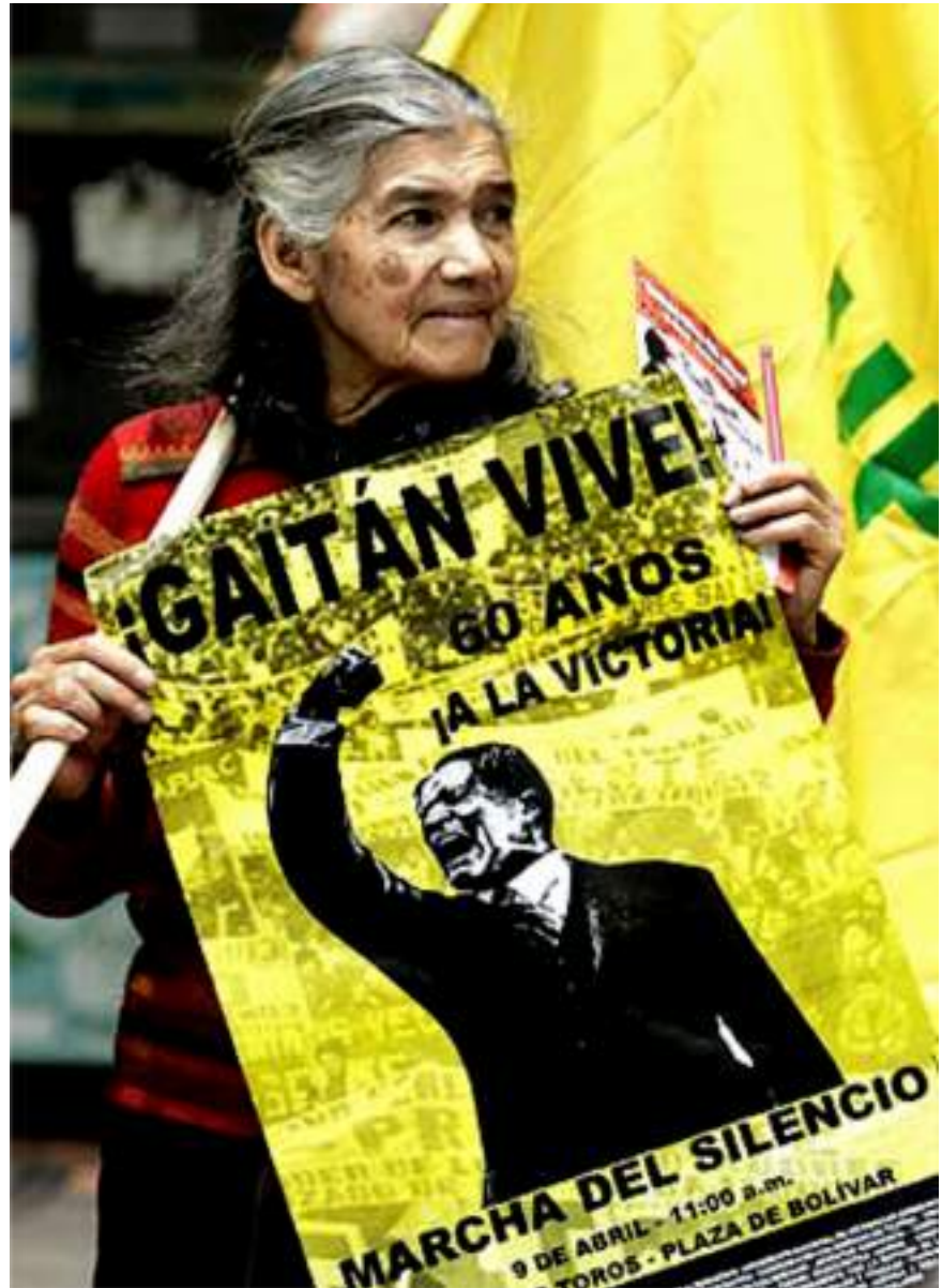
Una anciana sostiene un cartel en recuerdo del asesinado Jorge Eliécer Gaitán.

Con Pedro Gómez Valderrama entraron por la carrera séptima y descendieron por la Avenida Jiménez. Ya el