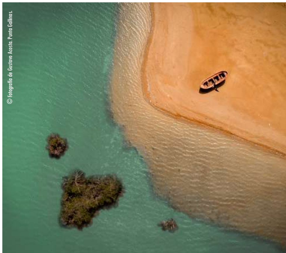
Punta Gallinas.

Nuestros atractivos turísticos son los más apetecidos por los viajeros y no precisamente porque no encuentre playas, desierto y dunas hermosas en otros destinos, el mayor encanto y que hace que un viaje sea una experiencia única es nuestra cultura wayuu, son nuestras tradiciones, usos y costumbres, además, porque conservamos nuestra lengua —el wayuunaiki— y somos tierra de