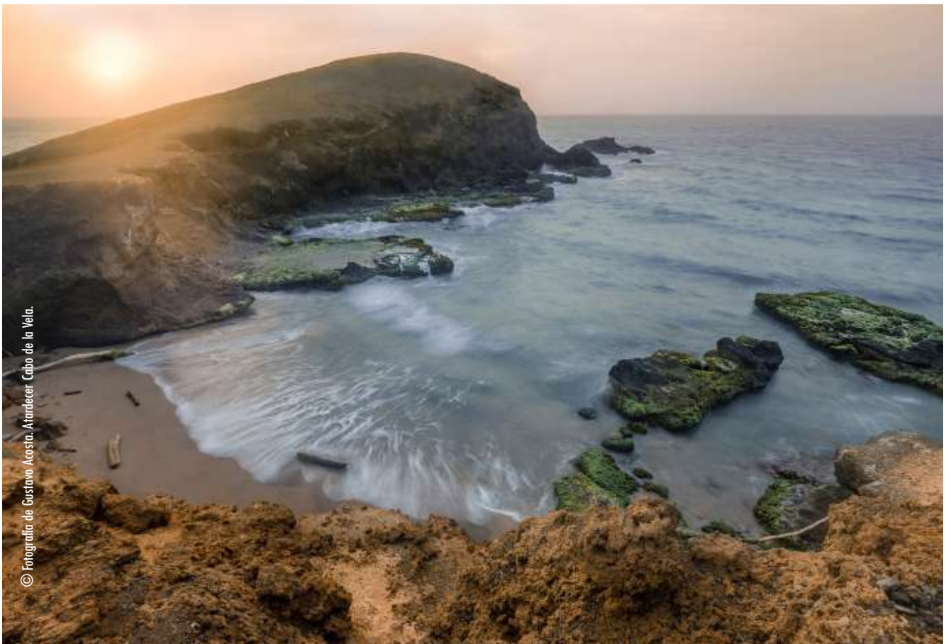
Atardecer Cabo de la Vela.