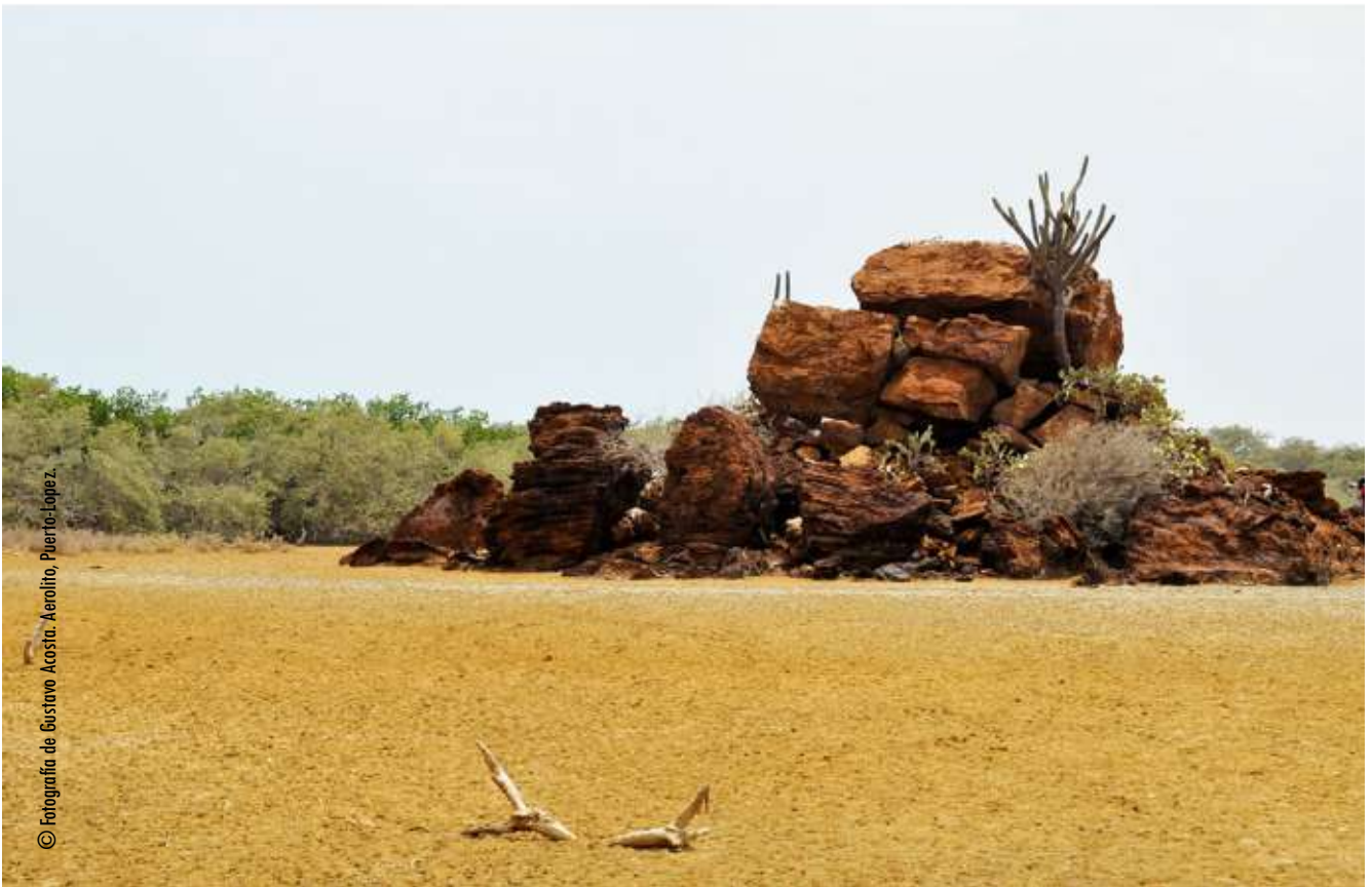
© Fotografía de Gustavo Acosta, Aerolito, Puerto López.