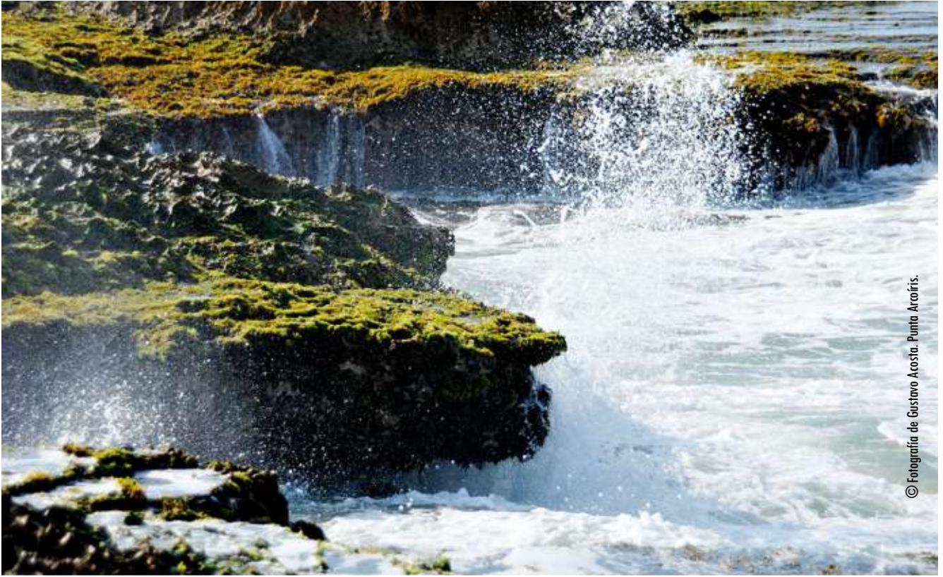
© Fotografía de Gustavo Acosta, Punta Arcañis.