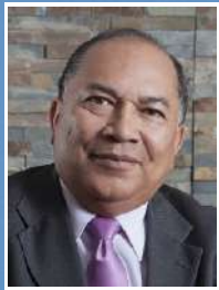
Amylkar Acosta Medina* [ Colaborador ]