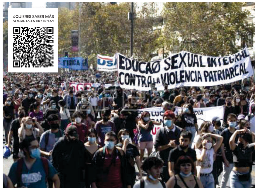
Instantánea de la primera protesta en la era Boric, en Chile. AgenciaEFE. Santiago de Chile, 25 marzo de 2022. https://www.efe.com/efe/america/sociedad/unheridodebalaenlaprimera granmarchauniversitariaetapaboric/

«Nada en el mundo es más peligroso que la ignorancia sincera y la estupidez concienzuda» decía Martin Luther King . Si Rodolfo llega a la presidencia se enfrentará a un estado enfermo que no sabrá gobernar: el estado y su complejidad escapan a su retina de no estadista. La simbiosis de la patanería y tozudez, autoritarismo, terquedad, será una cadena de fracasos y debe enmendarse temperamentalmente con prudencia y mesura. No escuchará a nadie. Los madrazos e individualismo dañino será su norte. Haría un gobierno difícil ante los retos macroeconómicos, sociales, de seguridad ciudadana, protección del medio ambiente, salud, educación e infraestructuras etc. Habla lo que la ignorancia mayoritaria quiere escuchar y nada de raro que sea presidente. No tiene asesores de talla y valía intelectual, aunque para la segunda vuelta muchos estarán a su lado asesorándolo. Creo también, —en mi modesto concepto— que Petro,