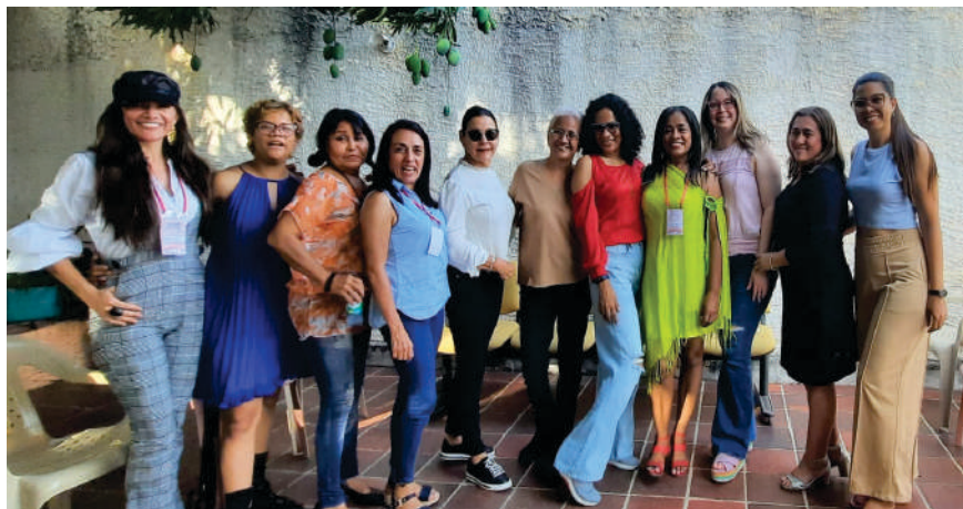
Invitados de honor y equipo de dirección y de trabajo de la Fundación Árboles Azules.

En el año 2018, al Festival Clemencia Tariffa de Codazzi, cuando como párvulos daban sus primeros pasos, le auguramos: “A futuro queremos verlos como el mejor festival de toda esta región y del país” . Se están dando pasos agigantados para hacer de esto una realidad. Gracias por ese significativo aporte