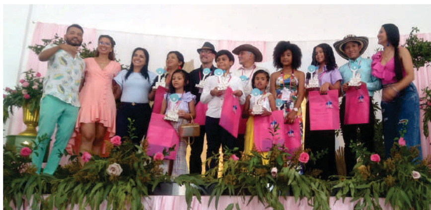
Grupo de ganadores del concurso de Declamación en el Festival, 2022.

De Colombia llegaron de muchos lugares, se hizo presente la Región Caribe en pleno, La Guajira, el Cesar y Magdalena; Atlántico, Bolívar, Córdoba y Sucre; Norte de San-