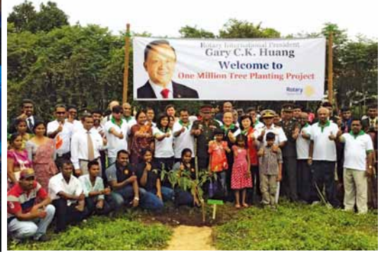
2014.12 斯里蘭卡，關於水源保護區，百萬植樹計劃