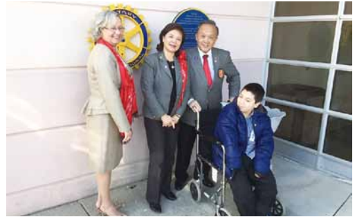
2015.03 加拿大柏林頓扶輪社的服務計畫。