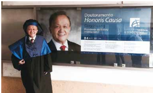
2015.05.04 葡萄牙 Lusofona University 榮譽博士