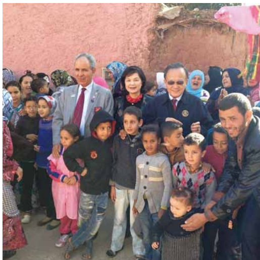
2014.11 摩洛哥扶輪社協助村民建造了水槽系統，讓村民能夠使用乾淨的水。