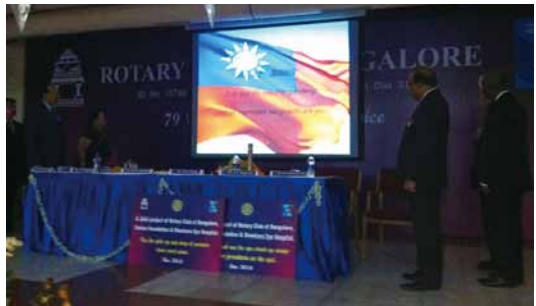
2013.12 在印度 ROC 國旗