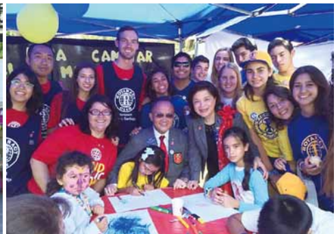
2015.02.28 智利 D4320、4340、4355 聯合扶輪日