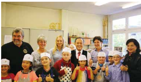
2014.11 德國柏林一所幫助孩童學習的安親學校。