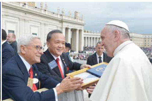
2014.11.12 頒贈國際扶輪「最高榮譽獎」給教宗方濟各 Pope Francis