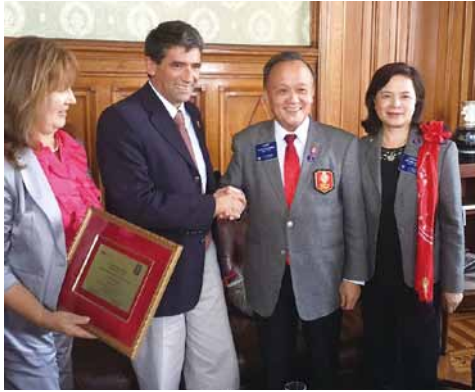
2015.03 烏拉圭副總統 Ral Fernando Sendic