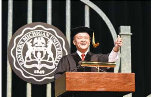
2014.12.20 美國 Eastern Michigan University 榮譽管理博士