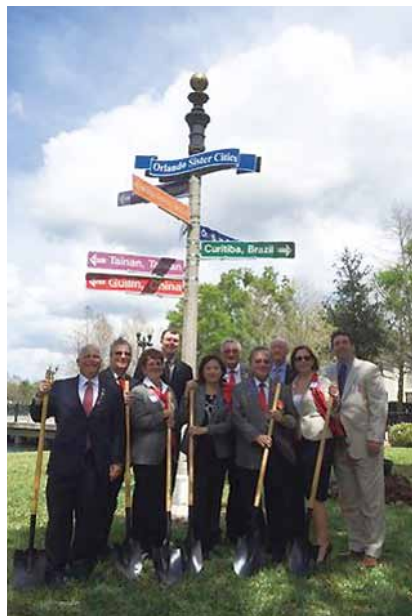
2015.03.13 在美國 D6980 Orlando 植樹，扶輪創辦人 Paul Harris 百年前也曾在此地植樹，且 Orlando 和台灣台南市是姐妹市。