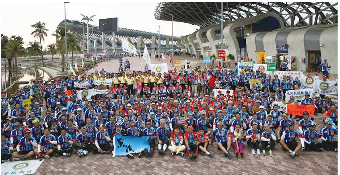
26 | 2014.10 台灣七個地區聯合舉辦單車環島募款 200 萬美元，響應根除小兒麻痺計畫。