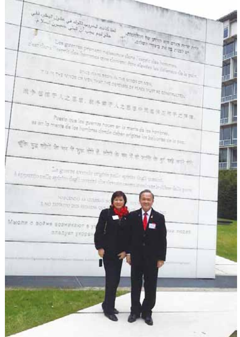
2015.04.04 法國 D1780 扶輪日，在 UNESCO 舉行「與扶輪及聯合國教科文組織共創和平」國際會議，並發表演講。