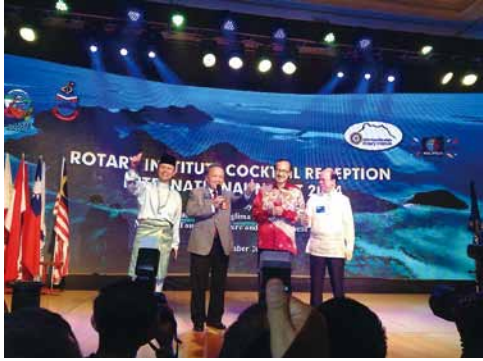
2014.11.21 馬來西亞沙巴，Zone 6B, 7A, 10B Rotary Institute