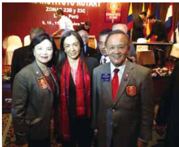
2014.10 秘魯副總統 Ms. Marisol Espinoza Gruz，同時是位資深扶輪社友。