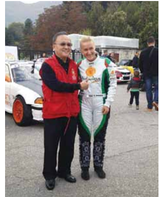
2014.10.13 保佳利亞 D2482 扶輪日，競速甩尾賽表演。