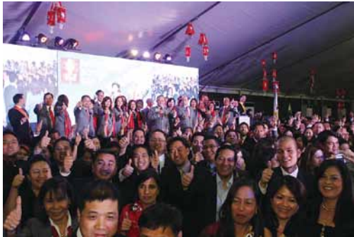
2014.08.22 馬尼拉 D3830 扶輪日，為 450 多位新社友舉行授證，菲律賓副總統 Jejomar Binay(也是社友) 蒞臨現場祝賀。