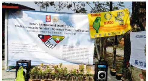
← 2015.02.02 在緬甸，由台灣 D3500 捐助淨水設備與技術。