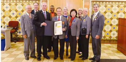
2015.01.12 二度獲頒美國 San Antonio 名譽市長