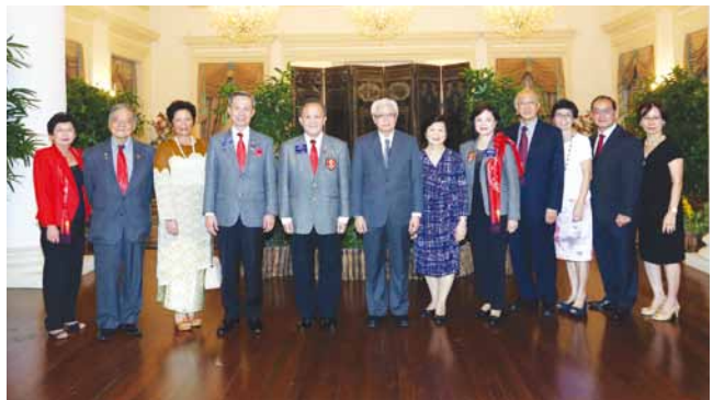
2014.12.22 新加坡總統 Mr. Tony Tan