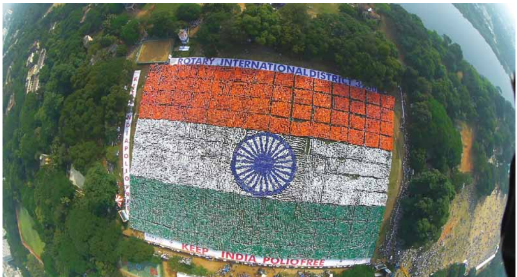
2014.12 印度 D3230 5 萬多名當地居民排列出了全世界最大的人類旗幟，創下世界金氏紀錄，同時象徵著小兒麻痺在印度已被根絕。