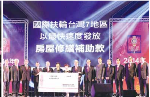
2014.08.30 台灣七個地區聯合捐助 2,500 萬，在 D3510 扶輪日捐贈給高雄市政府幫助高雄氣爆災害重建。