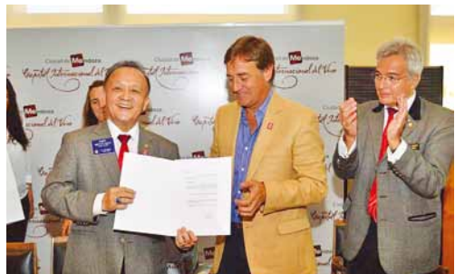
2015.03 阿根廷 Mendoza City 榮譽市長