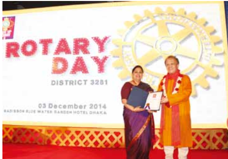
2014.12.03 孟加拉扶輪日