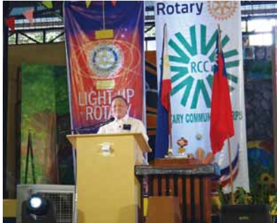
2014.08.22 在菲律賓 ROC 國旗