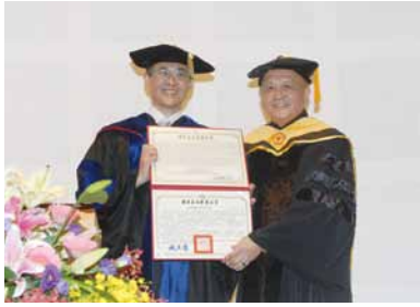
2014.05.16 台北科技大學名譽管理 博士