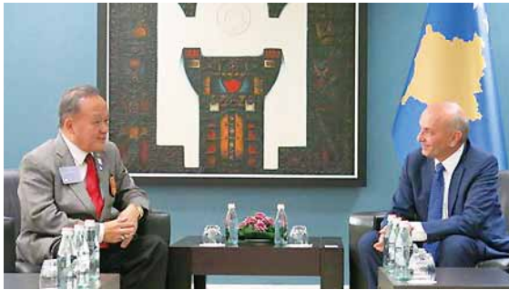
2015.04.29 科索沃共和國總理 Isa Mustafa