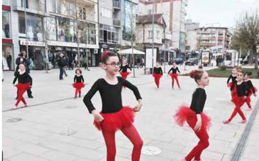
2015.04 科索沃共和國扶輪日