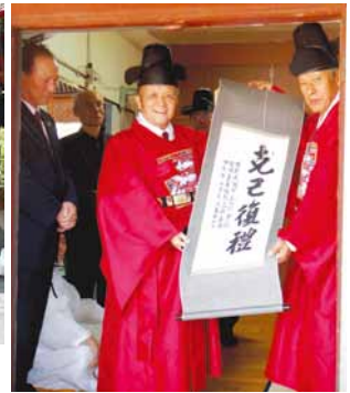
2014.09.28 韓國孔子誕辰慶祝活動