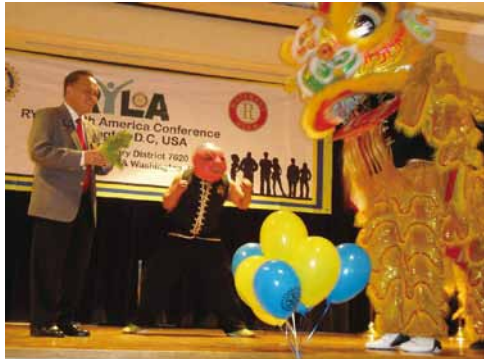
2014.08.03 美國華盛頓，RYLA 北美會議