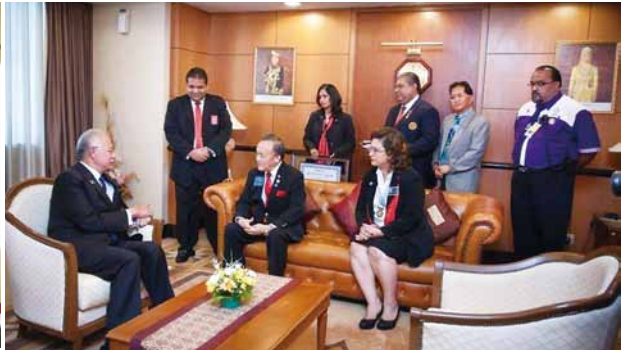
2014.11.20 馬來西亞總理 Mr. Najib Abdul Razak