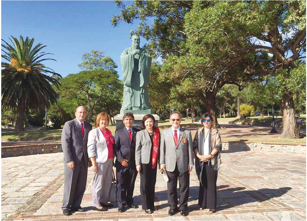
2015.03.08 烏拉圭扶輪日，參觀 Rodo Park 孔子塑像。