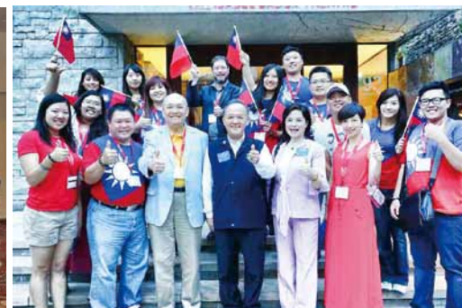
2014.07.27 加拿大多倫多，國際扶輪青年世界大會，台灣扶青团贏得2017國際扶青团世界大會主辦權