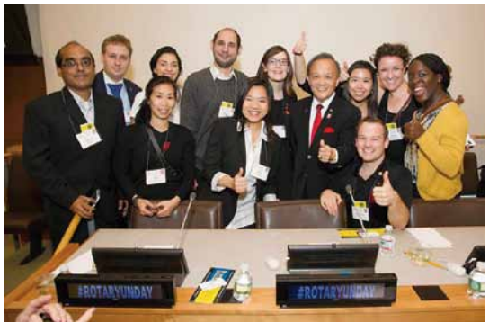
2014.11.01 為慶祝國際扶輪社與聯合國第 69 年的合作夥伴關係，於聯合國總部大樓舉辦 Rotary UN Day，在 UN 扶輪日演講及白宮演講。