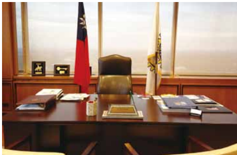
RI 芝加哥總部辦公室 ROC 國旗

一、出席世界各地的扶輪社會議時，會場飄揚著中華民國國旗，播放中華民國國歌，因而讓更多國外友人認識台灣。