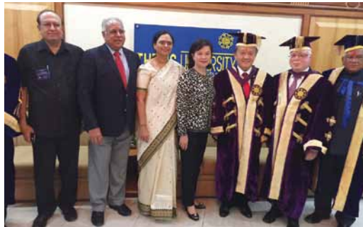
2014.12.08 印度 IIS University 榮譽社會科學社 區服務博士