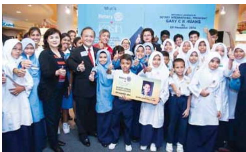
2014.11.20 馬來西亞 D3300 Rotary Kasih Project，為貧困學童提供技能訓練、教育與營養食物