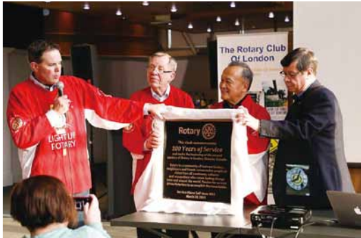
2015.03.13 加拿大 D6330 扶輪日及 RC London Canada 成立 100 週年慶