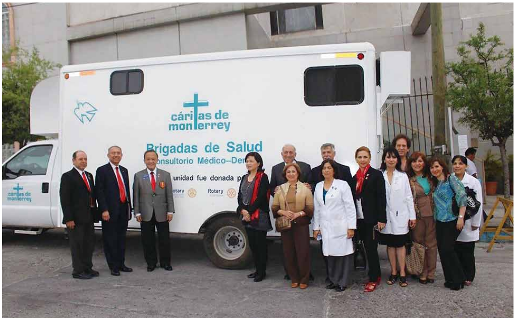
2015.03 墨西哥 D4130，為弱勢團體與兒童提供免費行動醫療護理服務的愛心計劃。