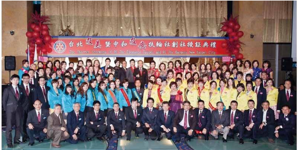
2014.12.24 台北及美社，中和及安社聯合創社授證典禮，108 位新社員。