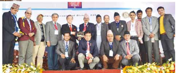
↓ 2015.02.06 尼泊爾，南亞和平會議