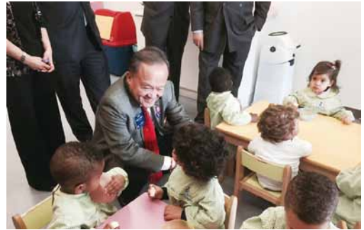
2015.05 葡萄牙 D1960 身障兒童捐助計劃。