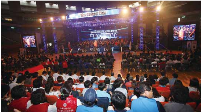
2014.09.28 韓國 D3661 釜山扶輪日演唱會，邀請 3 千多名社區居民參加。