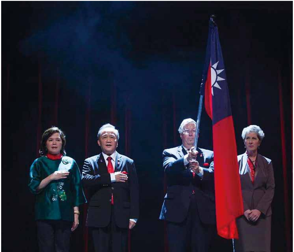
2015.06 .06 在巴西年會 ROC 國旗