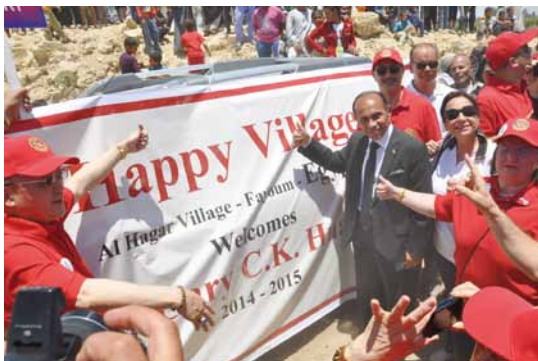
2014.06 埃及 D2451 Happy Village Project，幫助 Fayoum 7000 多位村民。