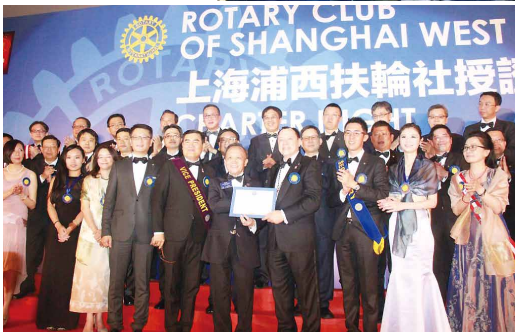
2015.05.21 上海浦西社創社授證典禮，是中國成立的第 7 個社，第一個華語社。