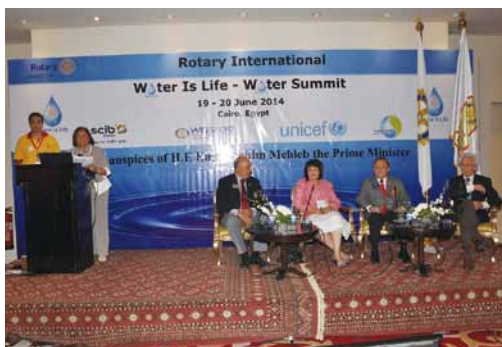
2014.06.19 埃及開羅，飲水高峰會議