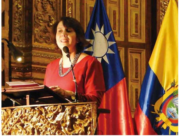
2015.03 在厄瓜多 ROC 國旗