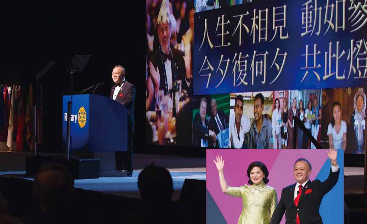
2015.01 聖地牙哥研習會