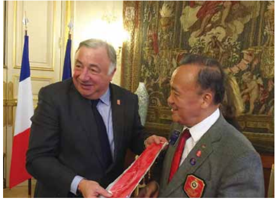
2015.04 法國參議院議長 Gérard Larcher，同時也是總理代理人。