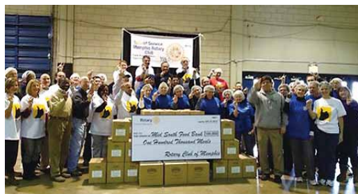
2015.01.10 美國 D6800 田納西州 Memphis Rotary Club 所主導的食物計畫。