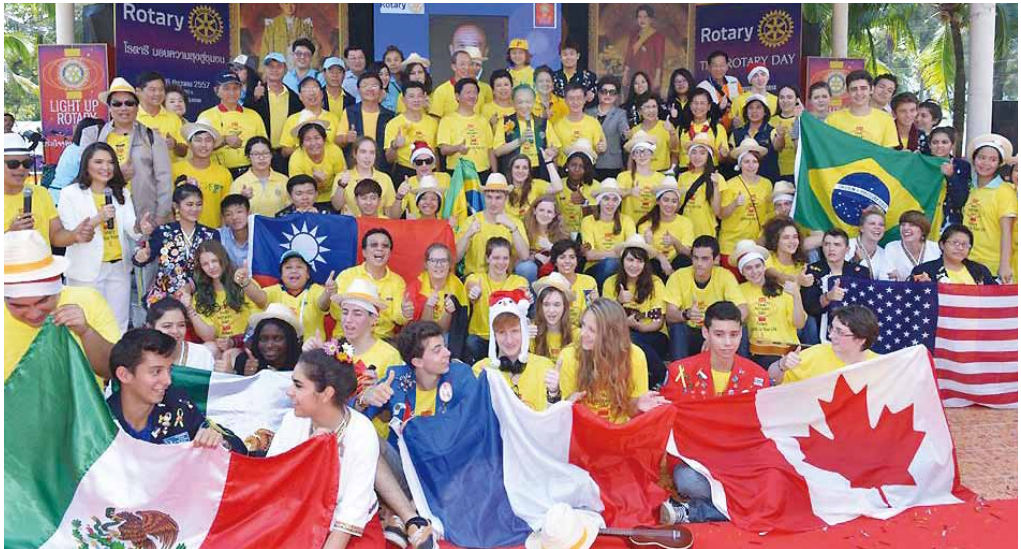
2014.12.26 在泰國 ROC 國旗