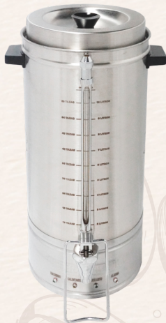
☕ 60 Tazas