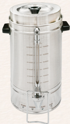
☕ 42 Tazas