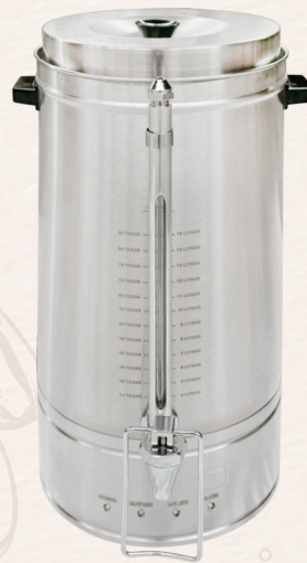
☕ 90 Tazas