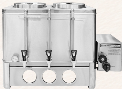
PERCOLADORA A GAS