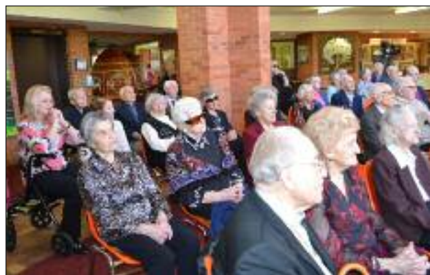
Residents and guests of our Mississauga Home during the Shevchenko concert.