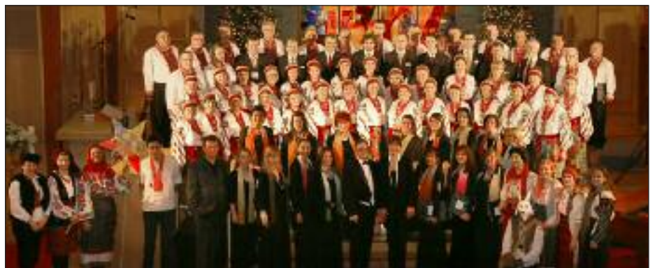
Мішаний хор "Левада" й "Оріон" (Торонто), колектив "Коса" та сербський хор "Кир Стефан Србин" після концерту.