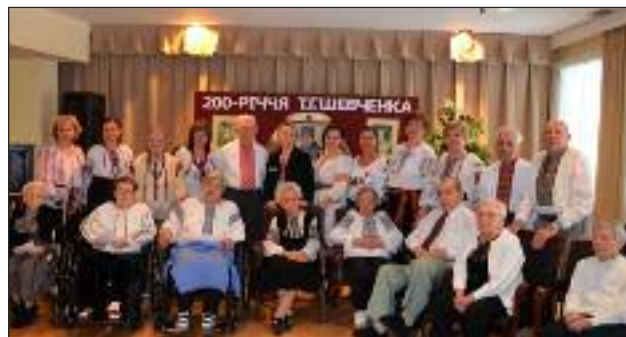
Residents and staff who participated in the concert.