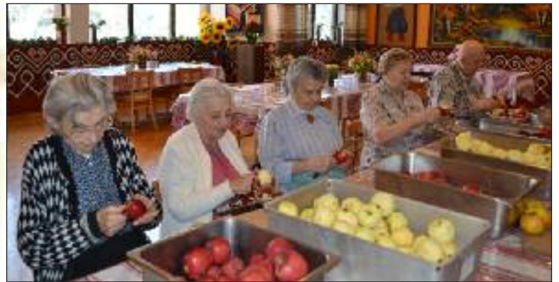
Мешканці Пансіону за чищенням яблук.