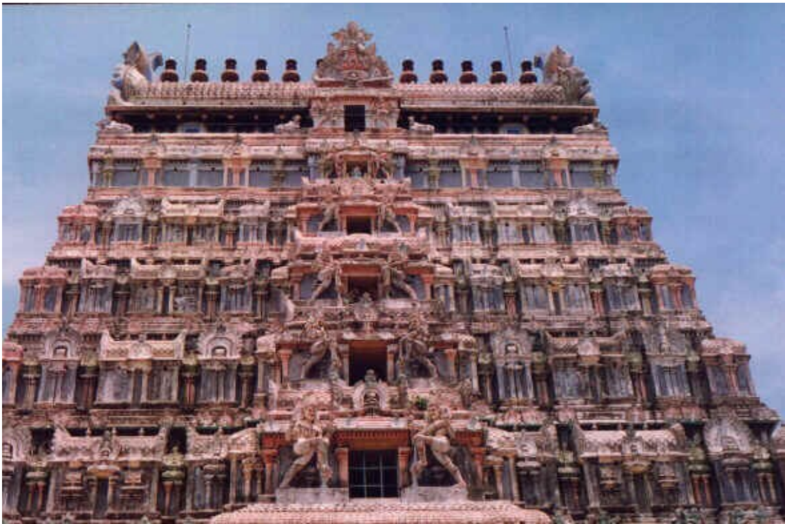
Templo de Cidambaram

Como en tiempos antiguos no se permitía a ningún escritor divulgar al público en lenguaje claro los secretos de la Ciencia Oculta, y como los libros y las bibliotecas podían ser fácilmente destruidas, ya fuera por los estragos del tiempo o por el vandalismo de bárbaros invasores se creyó conveniente preservar en forma de signos y símbolos para beneficio de la posteridad y en sólidos y durables edificios de granito algunos de los más grandes secretos conocidos por quienes proyectaron estas construcciones. La misma necesidad que dio nacimiento a la Esfinge y a la gran Pirámide, llevó a los antiguos líderes del pensamiento religioso indio a construir estos templos y a expresar en piedra y en metal el sentido oculto de sus doctrinas.