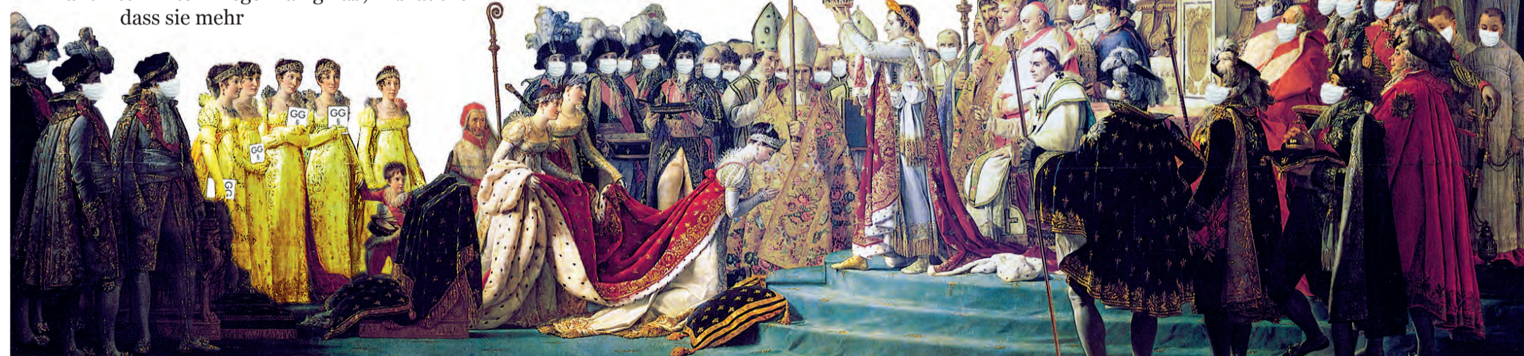
»Coronation«, Collage von Jill Sandjaja mit dem Gemälde »Le sacre de Napoléon« von Jacques-Louis David. In dem Moment, da Napoléon sich 1804 selbst als Kaiser krönte, endete die erste französische Republik.

Am 29.08.2020 wird wieder nach Berlin eingeladen, um die alt gewordene Gestalt der Republik zu erneuern. Wie wird das politische Berlin und dessen Infrastruktur mit den vielen Menschen aus aller Welt umgehen können (Seite 6)? - Wir bleiben friedlich, Provocateurs gehören nicht zu uns und Faschisten raus aus der Regierung (Seiten 2 und 8).