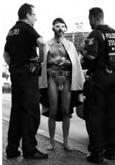
Die Welt zu Gast bei Freunden, das Berliner Gesicht des Widerstands Captain Future ist sich seiner Sache sicher.

Welch schmutzige, unlautere Tricks das Corona-Regime noch in Petto hat, um diese Veranstaltung zu verhindern, ist derzeit schwer abzuschätzen. Doch angesichts der zahlreichen, raffinierten Vorbereitungsmaßnahmen der Demokratiebewegung wird ersichtlich, wie anpassungs- und lernfähig das Freiheitsevirus ist, für dessen Eindämmung kein politischer Impfstoff verfügbar ist.