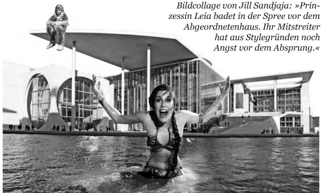
Bildcollage von Jill Sandjaja: »Prinzessin Leia badet in der Spree vor dem Abgeordnetenhaus. Ihr Mitstreiter hat aus Stylegründen noch Angst vor dem Absprung.«

Die Fragen stellten Anne Höhne und Hendrik Sodenkamp