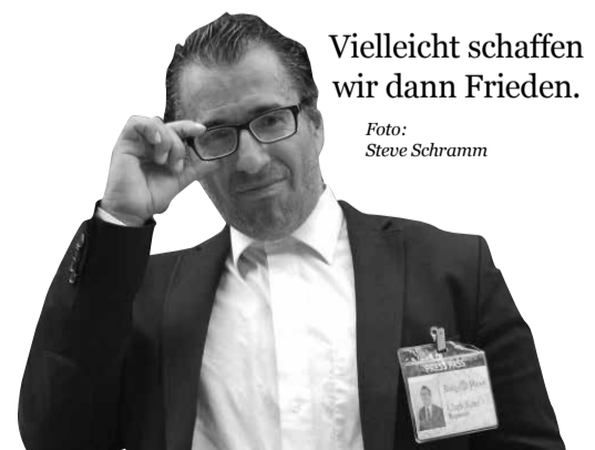
Vielleicht schaffen wir dann Frieden.

Kind weitergab, weil diesem kalt war. Nun, Sankt Martin war ein Soldat, der die Grausamkeit des Krieges sah, in Gestalt eines Bettlers. Er teilte, was er hatte, eben seinen Mantel, und gab die Hälfte davon ab. Er verließ das Militär und wurde ein Heiliger. Vielleicht sollten wir uns ein Beispiel daran nehmen und aufhören, Menschenleben zu gefährden, sondern das Herz sprechen lassen und das fahle Soldatentum aufgeben.