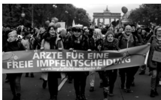
Ärztinnen im Widerstand am 18.11.

Knut Mellenthin arbeitete nach dem Geschichtsstudium von 1971 bis 1994 als Redakteur der Zeitung »Analyse & Kritik« (vormals »Arbeiterkampf«) sowie als persönlicher Mitarbeiter für Innenpolitik einer PDS/PdL-Bundestagsabgeordneten. Neben der Geschichte des Holocausts ( holocaust-chronologie.de ) schreibt er als ausgewiesener Experte zur internationalen Politik der Gegenwart.