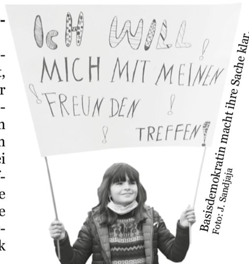
Basisdemokratie macht ihre Sache klar.

Das Interview führten Samoel Gfrörer und Jill Sandjaja, weitere Informationen zur Initiative: schulenstehenauf.de