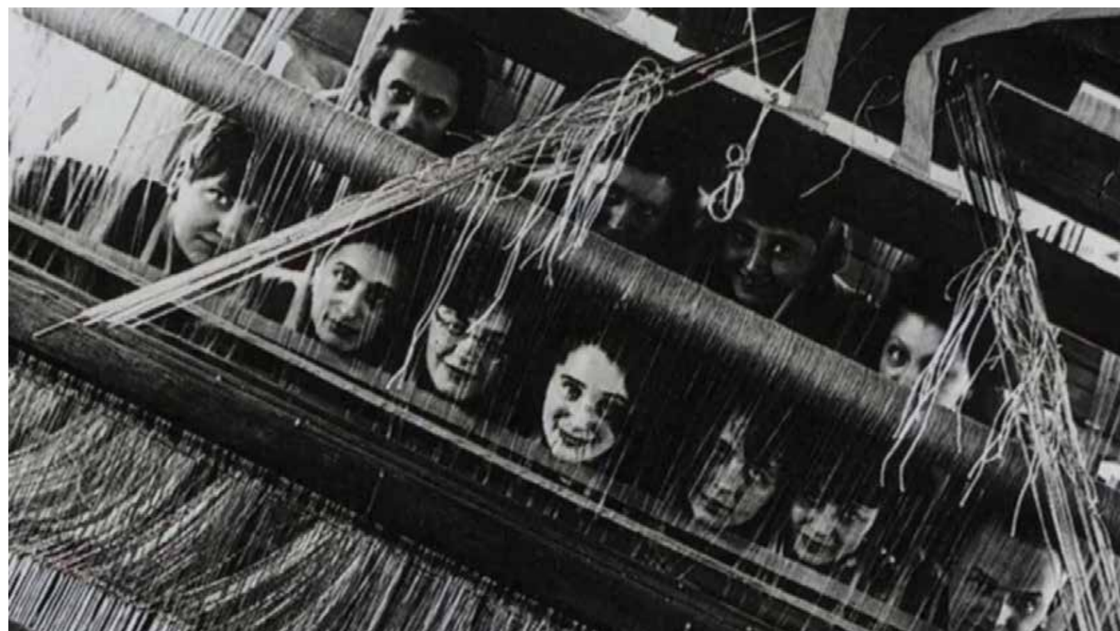
Ein Kollegium des Bauhauses beim »Weberaufstand«: Die Gruppe Bauhaus brachte Künstler, Handwerker und Arbeiter zusammen. Nach seiner nationalen Gründung durch Architekt Walter Gropius entfaltete die Kunstschule eine europaweit einflussreiche Konzeption und Stilistik.