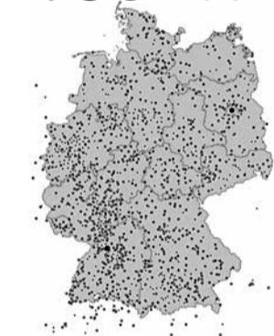
Collage: Ute Feuerstacke

Die Übersichtskarte (l.) zeigt die Anmeldungen von Aktivitäten von dezentralen und eigenverantwortlichen Gruppen der Demokratiebewegung nichtohneuns.de. Siehe auch querdenken-711.de , BewegungLeipzig.de und viele weitere. Demotermine (Ort, Zeit, Titel) an demokratischerwiderstand@protonmail.com .