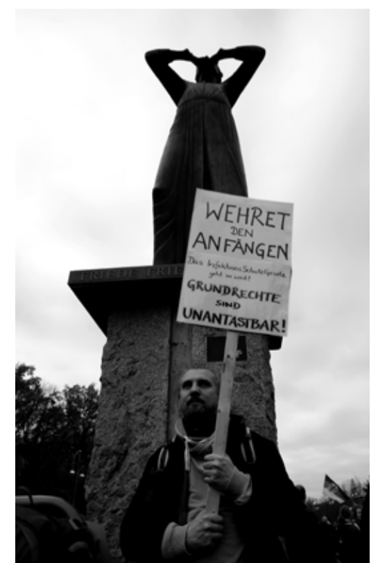
Klare Ziele von Anbeginn. Hier in Berlin am Tag der Selbsterstörung des Parlaments.