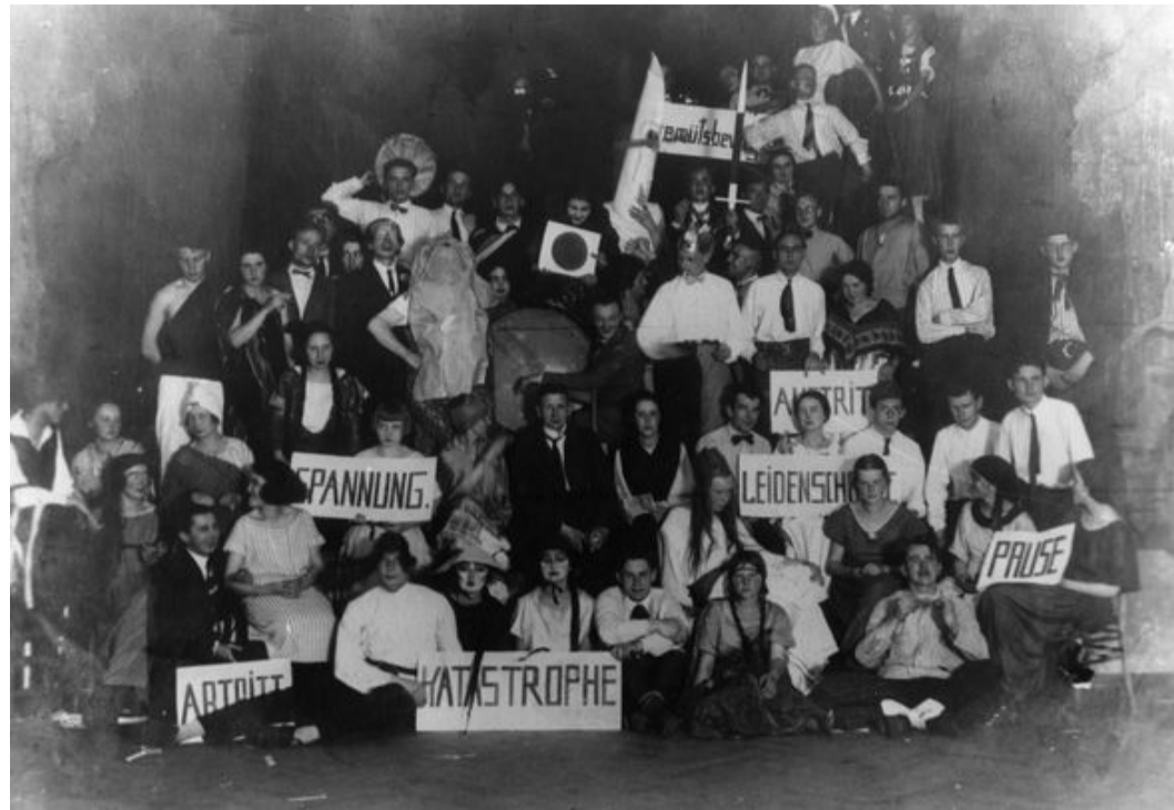
Bauhausfest am 24. November 1924 in der Gaststätte Ilmschlösschen bei Weimar.

Der Sozialismus versprach, dass man alles bekommen würde, was man brauche. Der Kapitalismus behauptet, wir bräuchten alles, was wir bekommen. Bevor wir weiter in einen neuen Faschismus abrutschen, müssen wir da-