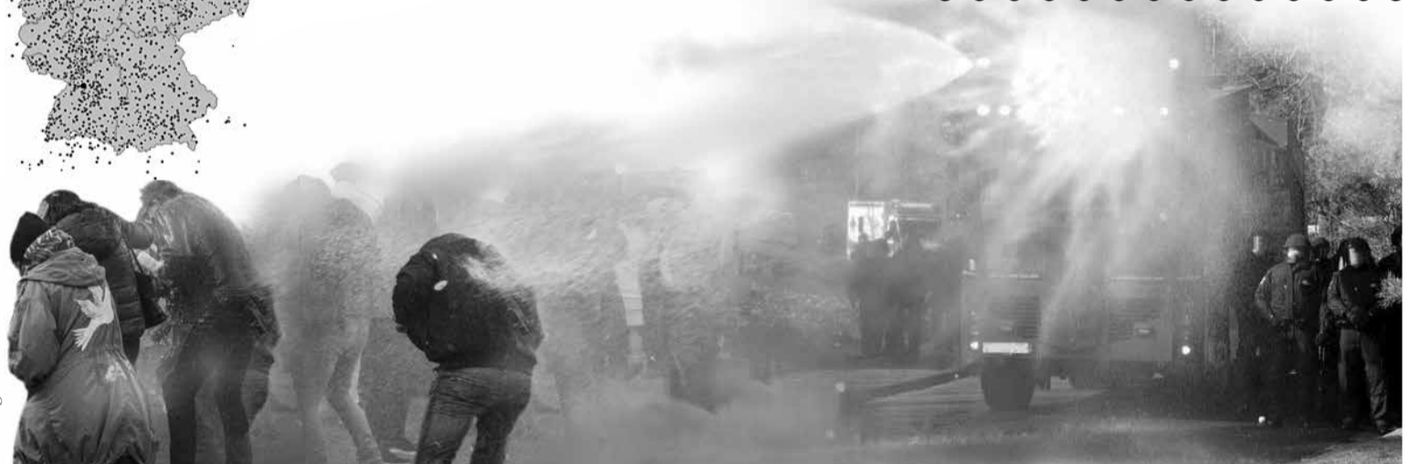
»Für die Gesundheit« setzt die Polizei neuerdings Wasserwerfer gegen friedliche Demokraten ein. Bei herbstlichen Temperaturen.

DANKE: Mit Ihrer Spende an die Kommunikationsstelle Demokratischer Widerstand e.V. unterstützen Sie den Druck dieser Zeitung, professionellen Journalismus und die Arbeit für die Grundrechte in der Bundesrepublik Deutschland. – Verwendungszweck »Crowdfunding« oder »Vereinspende« an Lenz/KDW, IBAN GB77 REVO 0099 7016 8700 94.