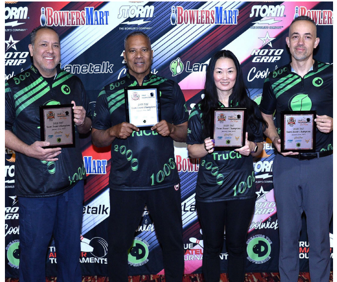
¡Los campeones del TAT Team Challenge de Las Vegas, NV se llevaron $10,000 a casa!