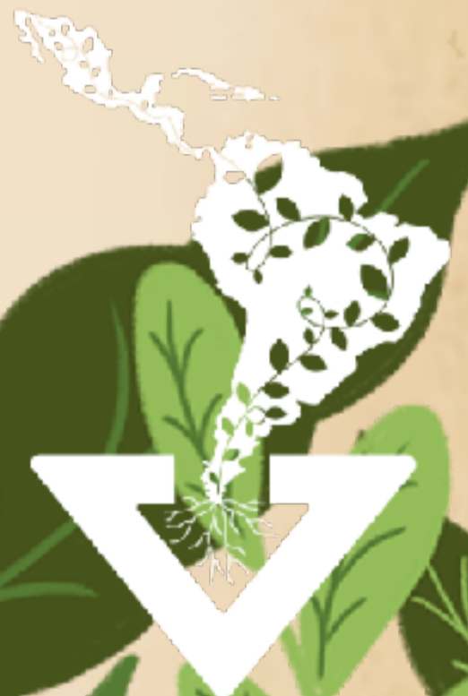
Imagen de portada: Iván Baltazar

PERMANECER EN LA TIERRA Latinoamérica y Caribe