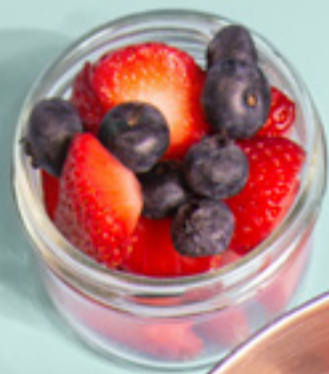
Power Bowl Fraises