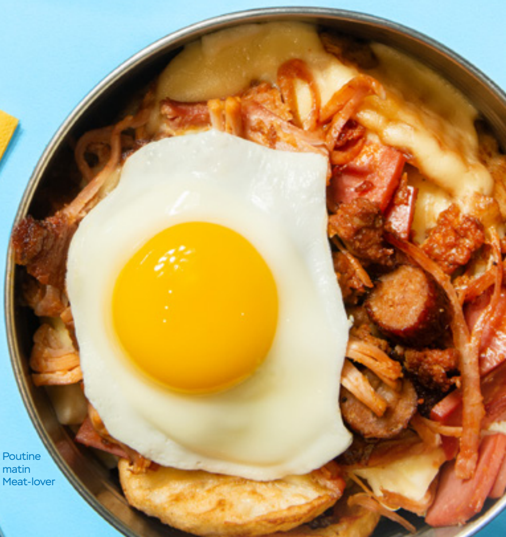
Poutine matin Meat-lover