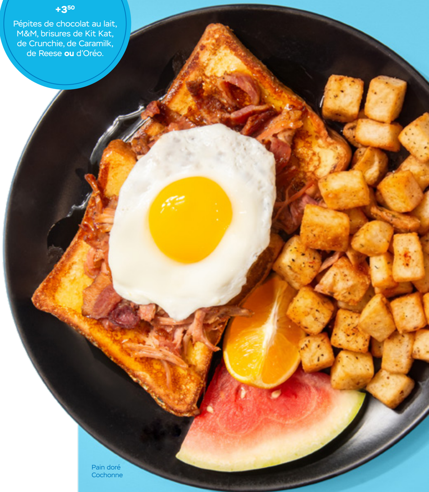
Pain doré Cochonne

Pépites de chocolat au lait, M&M, brisures de Kit Kat, de Crunchie, de Caramilk, de Reese ou d'Oréo.