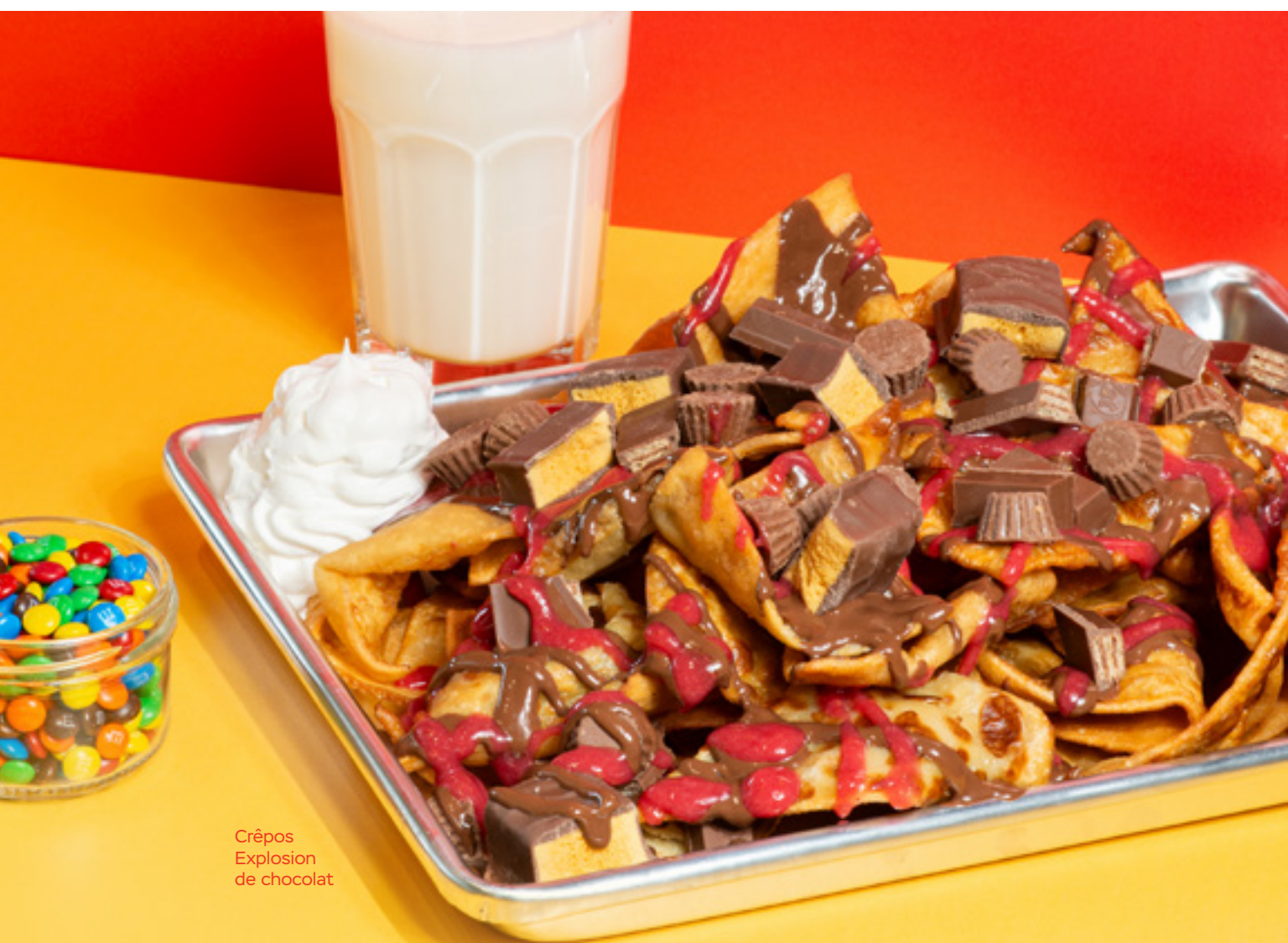
Crêpes Explosion de chocolat

Bacon de joue de porc, jambon d'épaule effiloché à la plaque recouvert de fromage mozzarella.