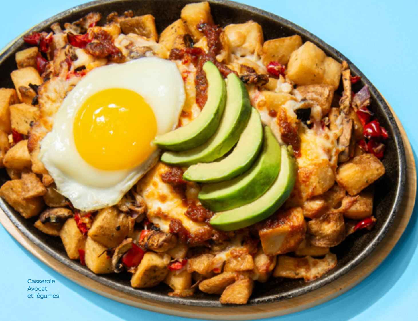
Casserole Avocat et légumes