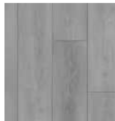
MINERAL GRAY TS-SPC4-6818