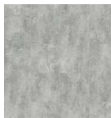
CONCRETE LITE TS-SPC6.5C-V2307