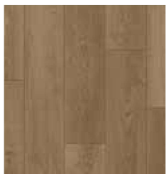
COLORADO RUSH TS-SPC5-0210