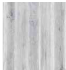
ASHLAR GRAY TS-SPC4-9163