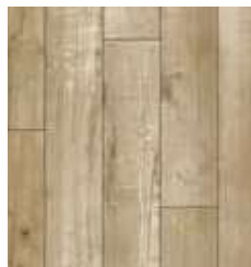
STERLING OAK TS-SPC4-1969