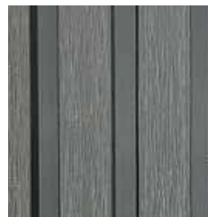
STONE GRAY TD-FWPC(2.85)-T5