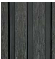
SILVER GRAY TD-FWPC(2.85)-T6