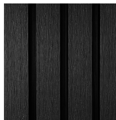
DARK BLACK TD-FWPC(2.85)-T8