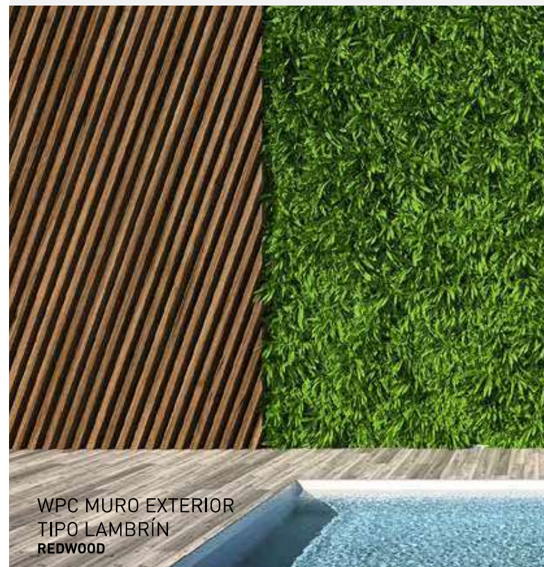
WPC MURO EXTERIOR TIPO LAMBRÍN REDWOOD