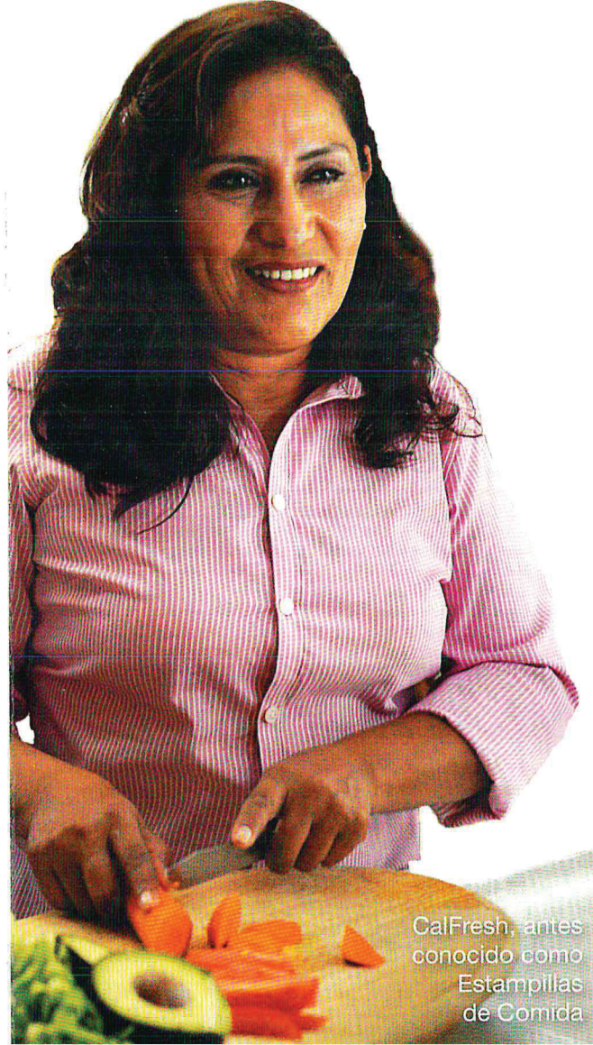
CalFresh, antes conocido como Estampillas de Comida