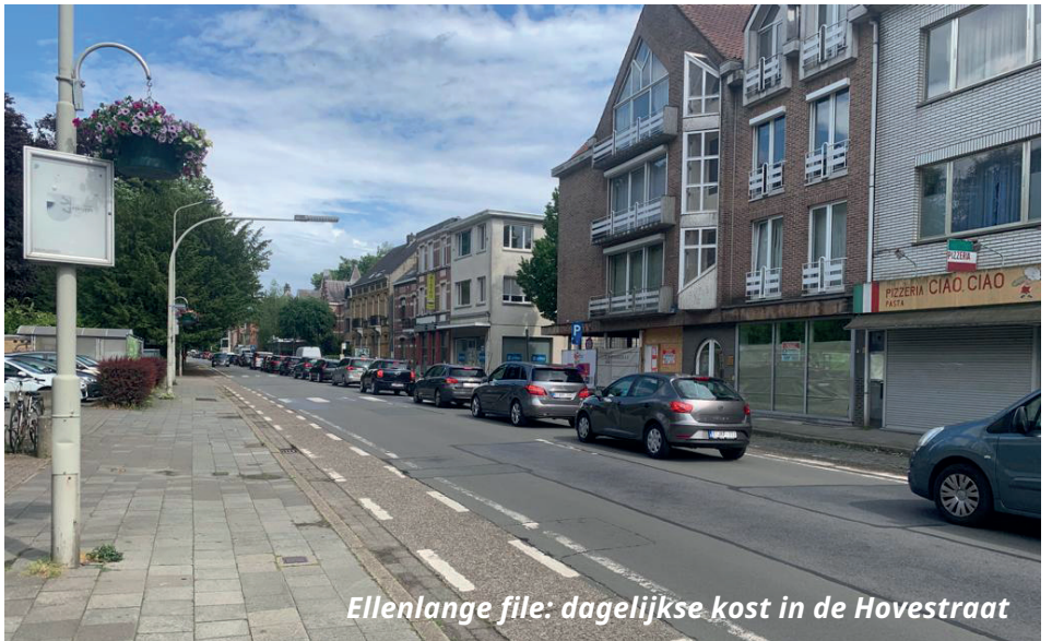
Ellenlange file: dagelijkse kost in de Hovestraat

De gemeente heeft als bijkomende randvoorwaarde wel een mobiliteitstoets opgelegd aan Antonissen Development. Maar de Beerschotburen hebben al aangegeven dat de cijfers van deze verkeerstelling onmogelijk correct kunnen zijn. Om te beginnen komen ze van een betrokken partij en zijn ze dus niet objectief.