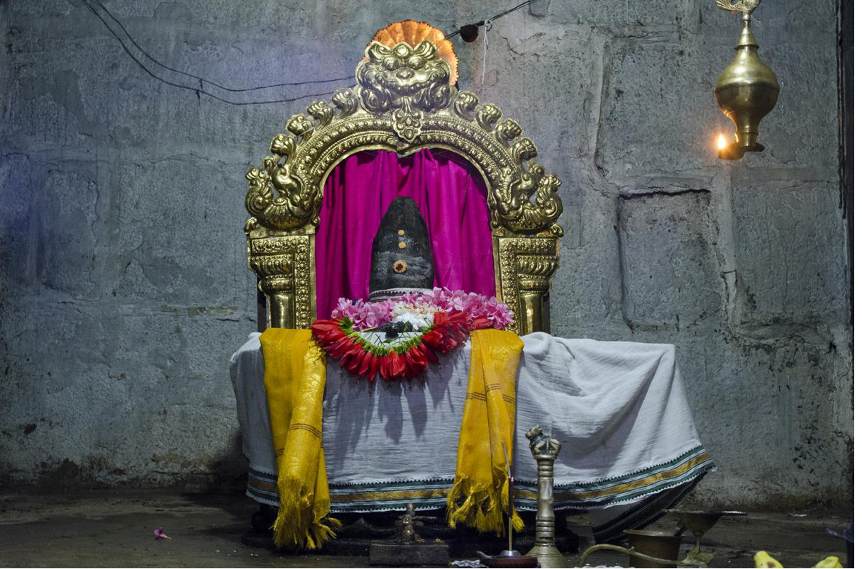
இடம்: ஸ்ரீ அக்னிஸ்வரர் ஆலயம், களக்காட்டுர், காஞ்சிபுரம்

உலகில் உள்ள அனைத்து பறவைகளும், விலங்குகளும் தங்கள் இனத்தோடு கூட்டமாக வாழவே விரும்புகின்றன. அதேபோலதான் மனிதர்களும் தனித்துவாழ்விரும்பாமல் குடும்பம் என்றபந்தத்தில் வாழ விரும்புகிறார்கள். நாம் ஒரு விதையை விதைத்தாலே அது நன்கு வளர்ந்து செடியாகி, மரமாகி, காயாகி கனி தர வேண்டும் என்றேஎண்ணுகின்றோம். மனிதர்களும் தங்கள் குலம்வளரவம்சம் வேண்டும் என்று ஆழமாகவும். குலம் வாழையடி வாழையாக வளர வேண்டும் என்றும் நினைக்கின்றனர். எனவே தான் திருமணம் முடிந்தபிறகுநல்லபிள்ளைபிறக்கவேண்டும் என்றுஎல்லோரும் விரும்புகின்றனர். ஆனால் பலருக்கு பல காரணங்களால் குழந்தை பேறு கிடைக்க தாமதம் ஆகின்றது. குழந்தைபேறுகிடைக்க பலன் தரும் பதிகங்களிலுள்ளகுழந்தைசெல்வம் வேண்டும் பதிகத்தைபக்தியுடனும் நம்பிக்கையுடனும் பாராயணம் செய்துபலனைப்பெறலாம். இப்பதிகத்தைப் பற்றி இறைவனின் பாதக் கமலங்களைவேண்டி இத்தொடரில் எழுதுகின்றேன்.