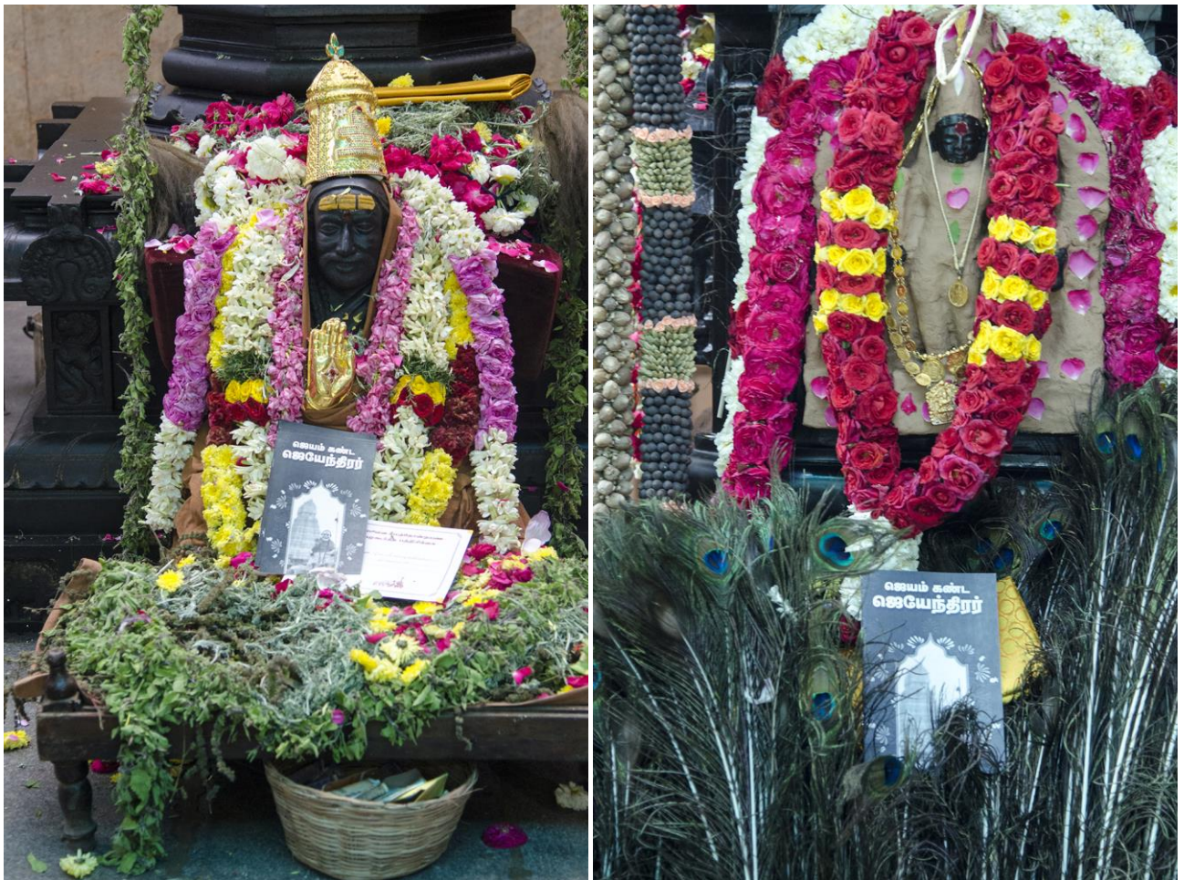
இடம்: மகா பெரியவா மற்றும் புது பெரியவா அதிஷ்டானம், ஸ்ரீ மடம், காஞ்சிபுரம் Image taken at Adhistanams of Maha Periyava and Pudhu Periyava, Sri Matam, Kanchipuram

மஹாபெரியவாளின் அனுகிரஹத்தாலும், அன்னை காமாட்சியின் கருணையாலும், என்னால் முடிந்த அளவு இறைப்பணிகளை செய்து வருகிறேன். இன்று போல் நீங்கள் எல்லோரும் தொடர்ந்து உங்கள் ஆதரவை தருமாறு அன்புடன் வேண்டுகிறேன்.