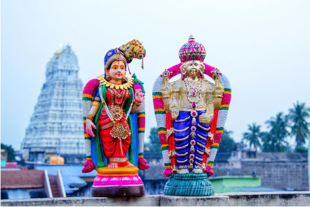
இடம்: எனது இல்லம், சின்ன காஞ்சிபுரம். பின்னல் அருள்மிகு தேவராஜ சுவாமி கோயில் Image taken at my home, in the background is Kanchipuram Sri Devaraja Swamy Temple

அன்பு சொந்தங்களுக்கு நெஞ்சார்ந்த வணக்கம். உங்கள் பூர்ண பலம் - புரட்டாசி மாத இதழுக்கு அன்புடன் வரவேற்கிறேன். புனிதமான புரட்டாசி மாதத்தின் பூர்ணபலம் உங்கள் பார்வைக்கு. வழக்கமான விஷயங்கள்தான். படித்து பயன் பெறுங்கள். இம்மாதம் பெருமாளுக்கு உரியது. எனவே அட்டை படத்தையும் அவரே அலங்கரிக்கிறார்.