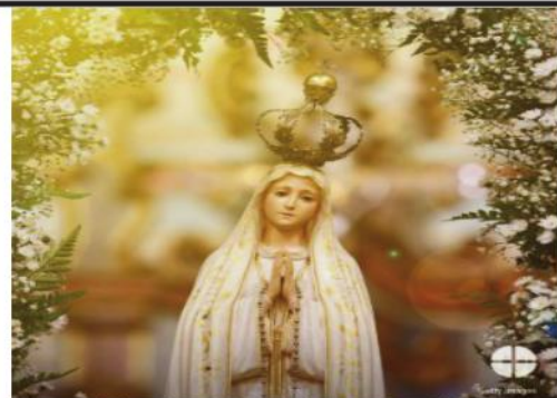
Our Lady Of Fatima (May 13)

We celebrate the Feast of Our Lady of Fatima! May we continue to take comfort in her presence and seek her intercession to bring peace to the world!