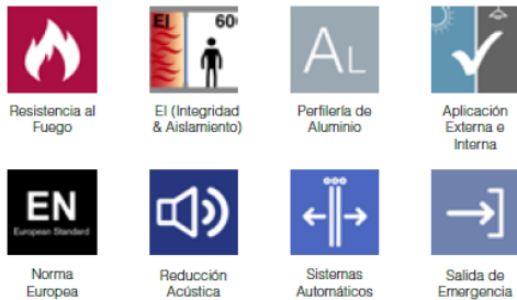
AS85 EI60 SISTEMA DE PUERTA UNA HOJA